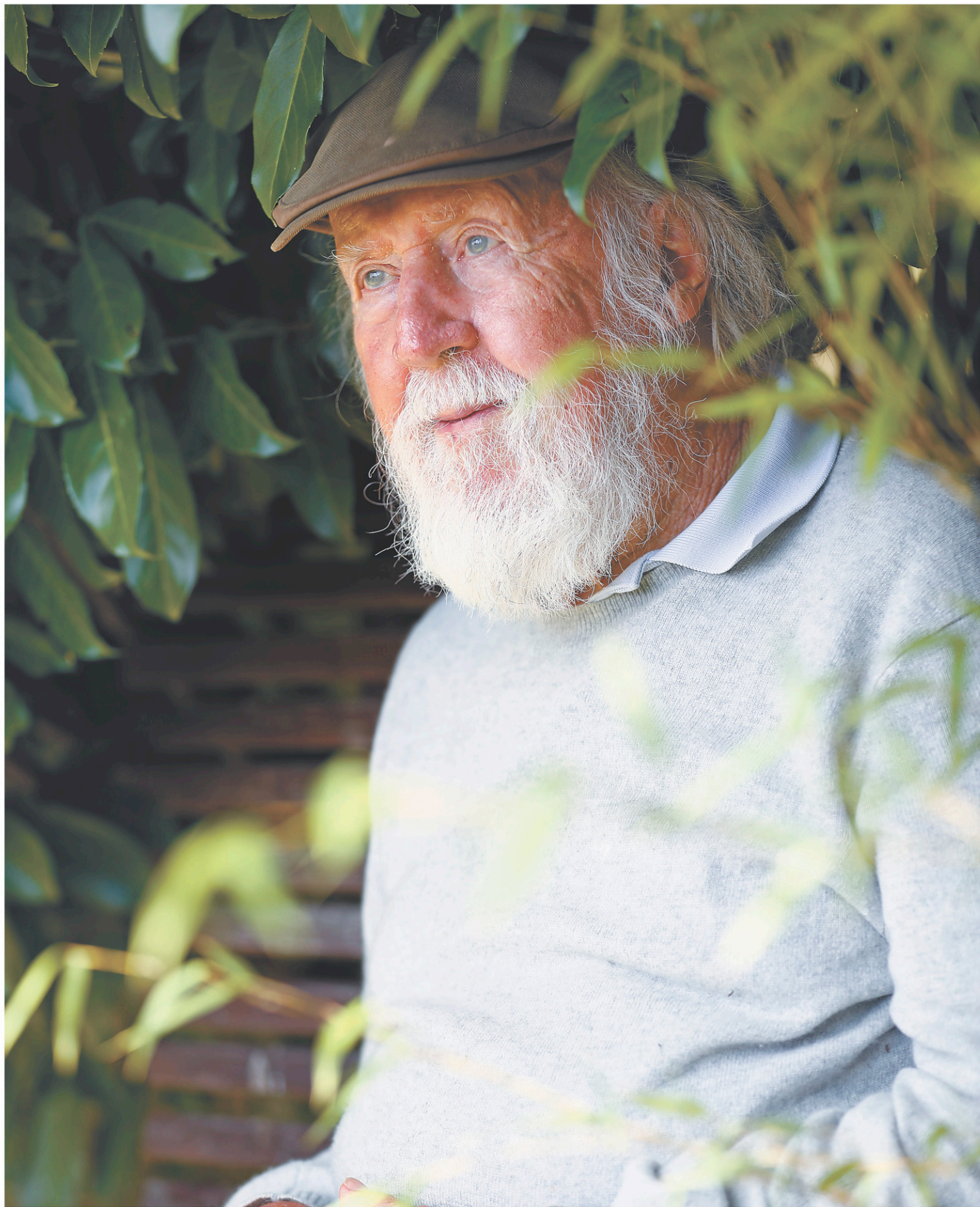
« Aujourd'hui, ce n'est pas la civilisation qui est en péril, c'est l'avenir de l'humanité », soutient Hubert Reeves.