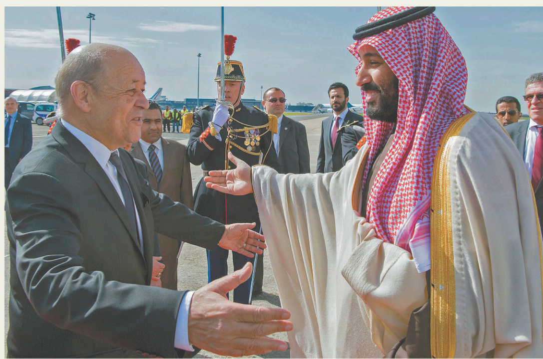
BANDAR AL-JALOUH/PALAIS ROYAL SAOUDIEN/AFP