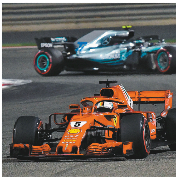
Le pilote allemand Sebastian Vettel, de l'écurie Ferrari, négocie une courbe de la piste du Grand Prix de Bahreïn.

Ce fut un week-end à oublier pour les pilotes Red Bull Daniel Ricciardo et Max Verstappen, qui ont été contraints à l'abandon tôt dans la course. Ricciardo a été ennuyé par des problèmes électriques, tandis que Verstappen a subi une crevaison au pneu arrière gauche.