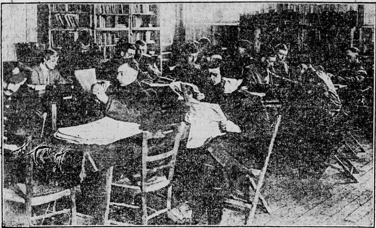
DES vétérans américains dans les salles de lecture de la fameuse Community House à Washington, D. C. Cet établissement est le plus complet qui existe aux Etats-Unis.