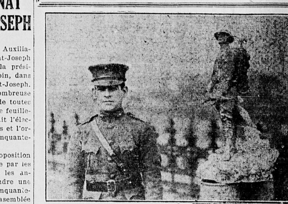
La fameuse statue du sculpteur Raphael Peyre, représentant un marin américain. Elle est placée sur la rive du Rhin, du côté américain. Elle excite chaque jour la curiosité des civils allemands qui passent à cet endroit.