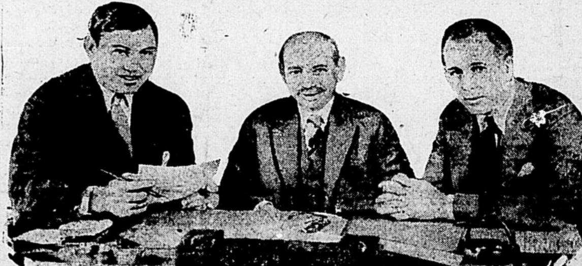
JACK DEMPSEY, MARCUS LOEW & JACK KEARNS

Jack Dempsey, le champion du monde, avec son gérant Jack Kearns et Marcus Loew. Jack signe un contrat de $10,000 par semaine, pour le circuit des théâtres Loew.