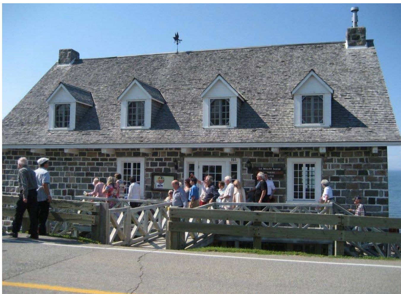
Moulin banal de Sainte-luce-sur-Mer