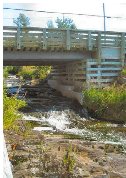
Ruisseau du Moulin banal