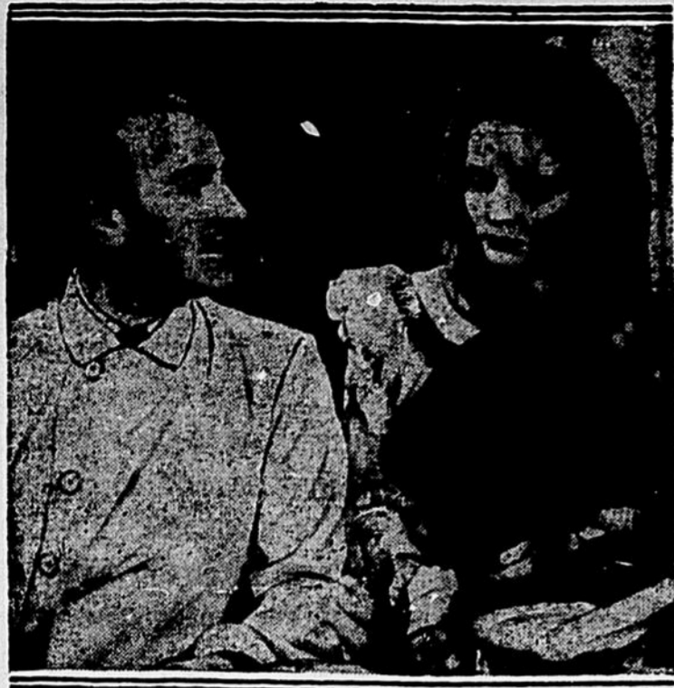
Jean Murat et Madeleine Sologne dans "Le Père Lebonnard" aujourd'hui au Saint-Denis en programme double avec Roger Duchesne dans "Le Mystère de la Maison Blanche". A droite, Maurice Chevalier et Marie Déa dans "Pièges" qui est gardé à l'affiche une quatrième semaine au Cinéma de Paris.