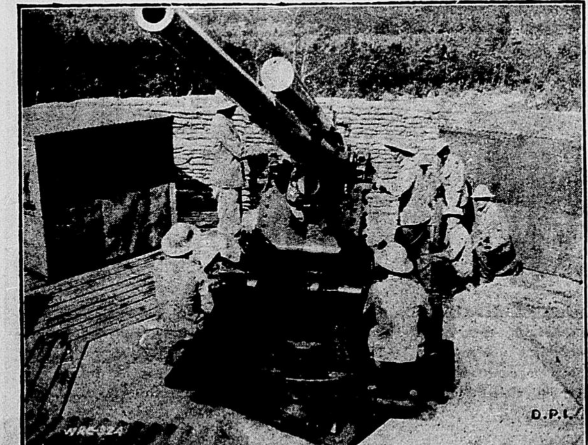
Les Etats-Unis qui viennent de livrer à la flotte britannique une cinquantaine de leurs destroyers en échange de bases sèches par l'Angleterre ont laissé à bord de ces bâtiments un canon doté d'un mécanisme particulier et secret qu'on a utilisé sur cette photo pour empêcher que les agents d'Hitler s'en prennent connaissance.