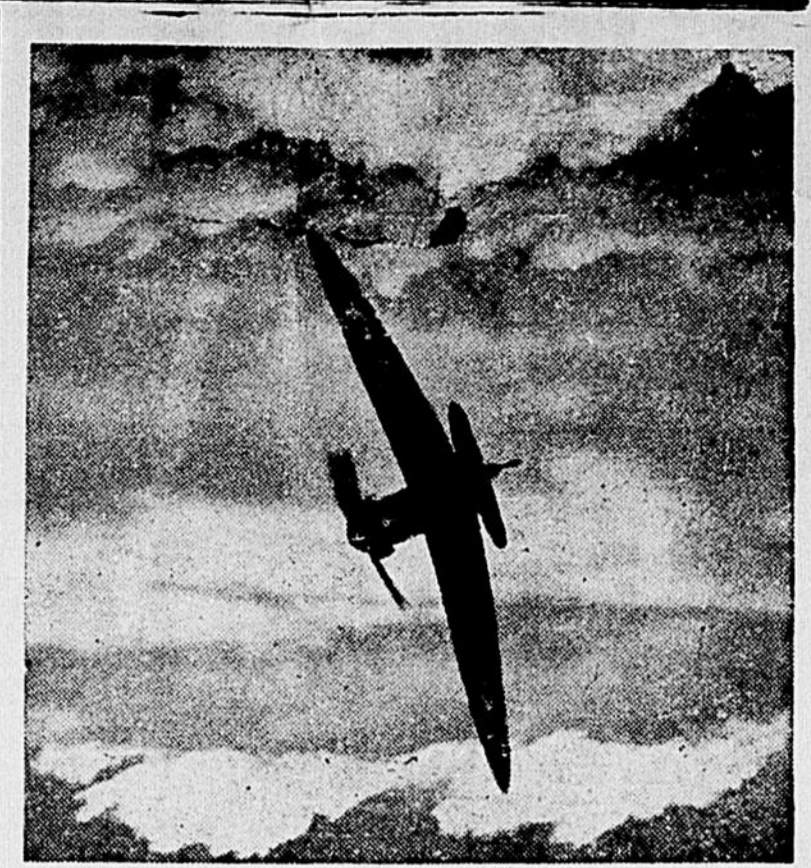
Voici un Spitfire, l'avion de chasse britannique qui cause tant de dégâts à l'aviation allemande. Un pilote du Spitfire n'hésite jamais à se mesurer contre trois ou quatre avions nazis, assuré que le feu concentré des huit mitrailleuses placées dans les ailes lui vaudra au moins la victoire sur un ou deux de ses ennemis.