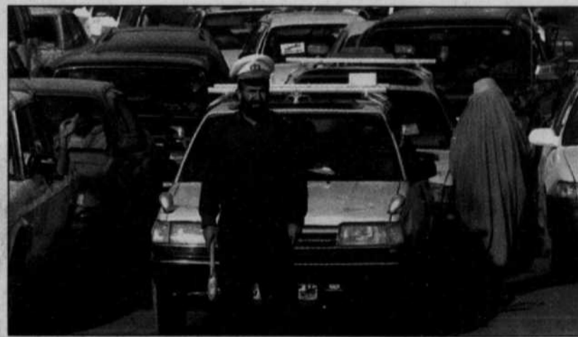
Embouteillage à Kaboul, où sont réunies, presque trois ans après la chute des talibans, toutes les contradictions d'une ville moderne. Pendant qu'une minorité fait des affaires d'or, de larges pans de la société afghane vivent dans une pauvreté abjecte, sans toit et sans emploi.