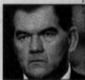
Tom Ridge, ministre de la Sécurité intérieure

En revanche, l'état d'alerte pour les États-Unis dans leur ensemble reste au niveau «élevé» ou jaune, a précisé M. Ridge.