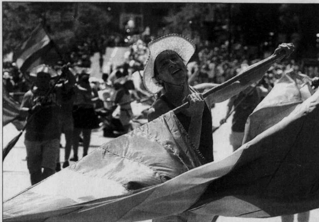
Danseurs, joueurs de tam-tam, drag queens, porteurs de drapeaux, femmes aux seins nus, toutes les conditions étaient réunies encore cette année pour faire du défilé organisé par Divers/Cité un succès populaire.