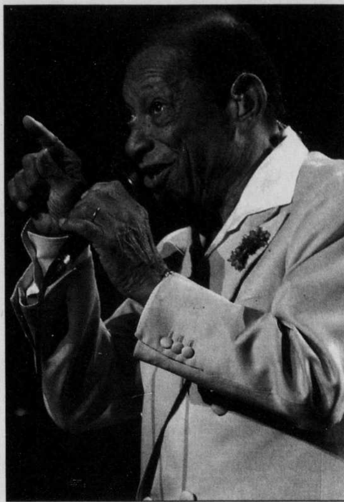
Henri Salvador, crooner et cabotin.

Si le fils de Guyane n'a pas été jusqu'à contourner les incontournables, serinant délicieusement Le Loup, la biche et le chevalier (une chanson douce) et l'exquise Syracuse , et s'il a dûment salué l'ami Vian avec deux brèves jazz très Saint-Germain-des-Près ( Taxi, Trompette d'occasion ), on ressortait avec des airs neufs en tête, la ballade bluesée J'ai tant rêvé , la très funky Toi , la version «bossanovée» de Vous , empruntée à Béart. On ressortait aussi avec cette image incroyable d'un Henri Salvador plus en forme que vous et moi, ne ménageant ni stepettes ni «scats» à la Louis Armstrong. A 87 ans, j'en jurerais, il en faisait plus que la fois d'avant. A 85. Quand il était jeune.