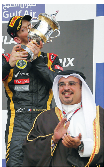
La course, gagnée par Sebastian Vettel (derrière sur la photo), s'est disputée devant le prince héritier du royaume de Bahreïn.

À l'aube, des jeunes masqués protestant contre la te-