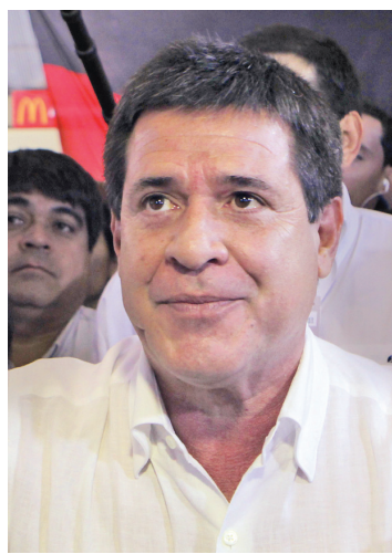
Horacio Cartés, héritier de la dictature, homophobe et patron d'un empire industriel opaque

Longtemps annoncé comme favori dans les sondages avant que des enquêtes ne donnent les deux candidats au coude-à-