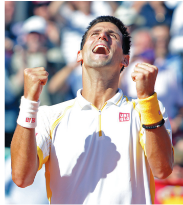
Novak Djokovic

Nadal a ensuite pris la mesure de Roger Federer au cours des trois finales suivantes. Ses huit titres consécutifs constituaient un record du circuit de l'ATP pour un seul tournoi.