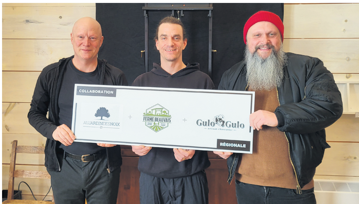
Les producteurs ont dévoilé le logo issu de cette collaboration.

Le charcutier de L'Assomption se démarque par sa façon artisanale de transformer la viande. «On ne travaille aucunement avec des bases industrielles, seulement avec les procédés qu'on utilisait à l'époque. L'objectif est d'œuvrer avec des produits lanadois et québécois et de respecter la viande en faisant ressortir ses saveurs naturelles et en les laissant parler d'elles-mêmes, sans nitrite et sans ajouts inutiles», a déclaré M. Barrette.