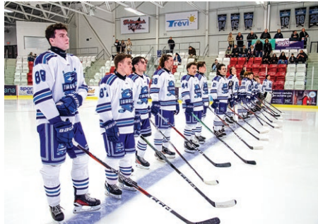
Les Torrents se sont inclinés 6-3 devant les Stingers, lors de leur premier match.

La partie a semblé se jouer en plusieurs actes : alors que Concordia a dominé les