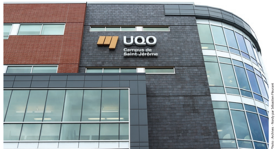
Présentement, il y a une vingtaine d'étudiants internationaux au campus de Saint-Jérôme de l'UQO.

Cette dernière déplore aussi le flou entourant le projet de loi et son application. « C'est un peu nébuleux », dit-elle. « J'entends bien que le ministre ne veut pas nuire aux régions, mais est-ce qu'il va penser que nous ? On est dans la région des Laurentides et dans celle de l'Outaouais. Est-ce qu'on sera une seule entité avec un quota nonobstant la région ? Ce sont des choses que je ne sais pas ».