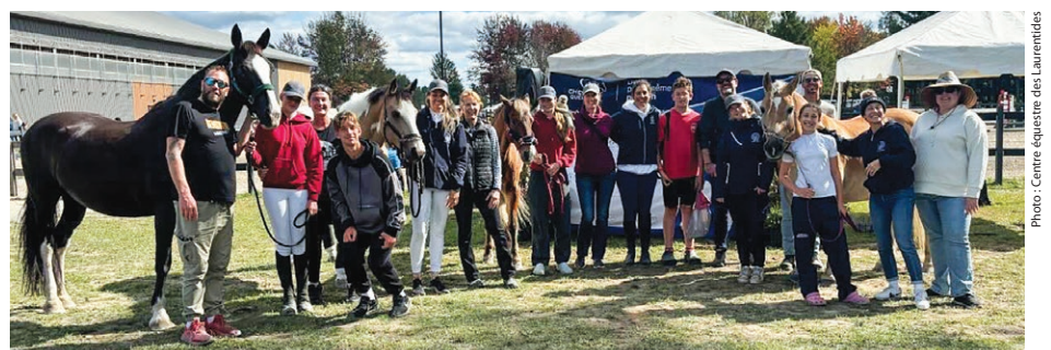
L'équipe (incluant les parents) du Centre équestre des Laurentides Dressage des roses, de Morin-Heights, a salué les résultats obtenus à la Caballista 2024, à Bécancour.

« Nous sommes une écurie spécialisée en dressage, qui est une discipline d'équitation classique. Je suis si heureuse d'être maintenant dans la vallée de Saint-Sauveur. J'adore le milieu et c'est vraiment un magnifique environnement d'apprentissage pour nos jeunes et les poneys et chevaux. Nous nous occupons aussi de pensionnaires. Nous avons déménagé de Mirabel à Morin-Heights. C'est plaisant dans les Pays-d'en-Haut, avec des gens et une clientèle sportive », a-t-elle ajouté.