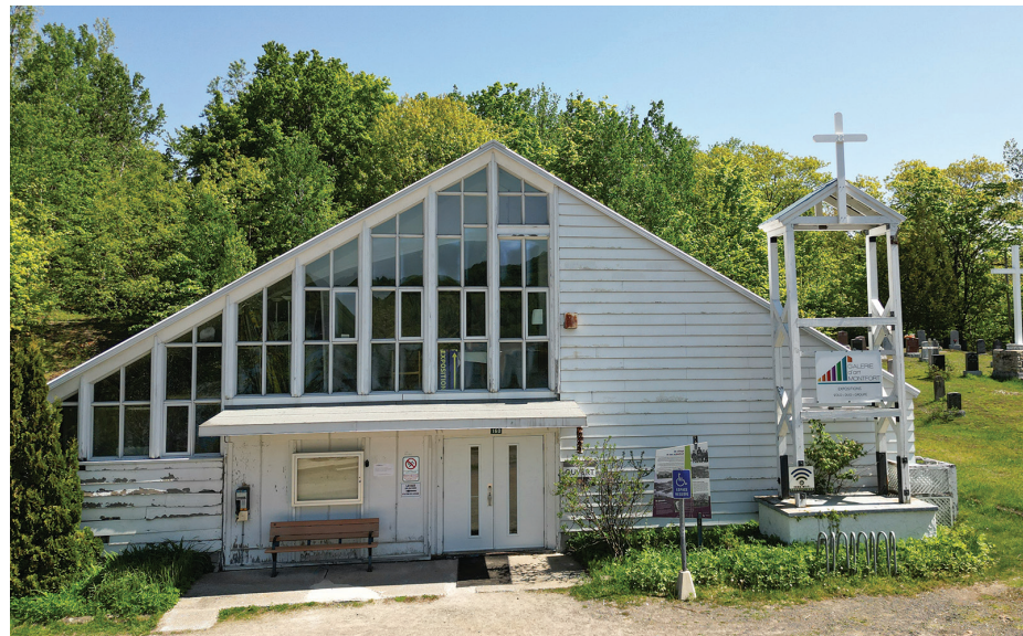
faut rendre une nouvelle bâtisse accessible à nos producteurs de bouffe locale, rendre disponible un local mieux aménagé pour l'Étoile du nord, et avoir une petite salle de spectacle comme point central à la municipalité. Un nouveau pavillon peut devenir ce point de revitalisation. »

Même s'il est trop tôt à ses yeux pour fixer un budget précis pour une nouvelle salle communautaire, la première dame connaît les besoins de base. « Des rénovations majeures n'ont pas eu lieu jusqu'à maintenant. Le comité aviseur, très compétent, a fait le tour de la problématique. La réalité, c'est que le pavillon Montfort n'est plus adéquat. Avec les changements climatiques qui déferlent, il doit devenir un lieu de refuge et communautaire à la fois. Mais dans sa condition actuelle, il ne répond plus aux critères : deux petites salles de bain, pas d'eau ni de puit artésien, le chauffage limité... Il se trouve même de l'amiante