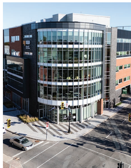
Le Campus de Saint-Jérôme de l'UQO.

Autrement dit, il manque d'enseignants pour former les nouveaux pendant leurs stages.