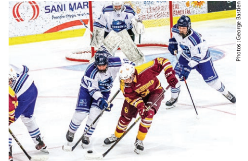
Les Torrents de l'UQO jouaient le premier match de leur histoire à Saint-Jérôme.

« On aura des choses à analyser et à travailler en attaque à cinq. C'est seulement l'exécution qui faisait défaut, rien d'alarmant, si tôt en saison. Ça risque d'être facile à corriger. Les gars se sentaient dans le coup et ont sorti très