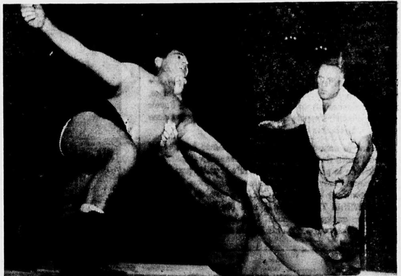
Une des scènes palpitante du combat entre Pat O'Connor et Argentina Rocca disputé hier soir au Forum. Après que chaque adversaire eut pris une chute ils furent tous deux comptés en bas de l'arène après quatre minutes et 15 secondes de l'engagement final.