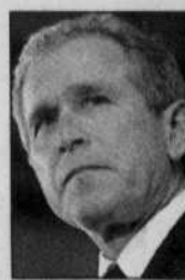
George W. Bush

Ce projet doit, selon le président américain, «encourager le Conseil de gouvernement transitoire irakien à