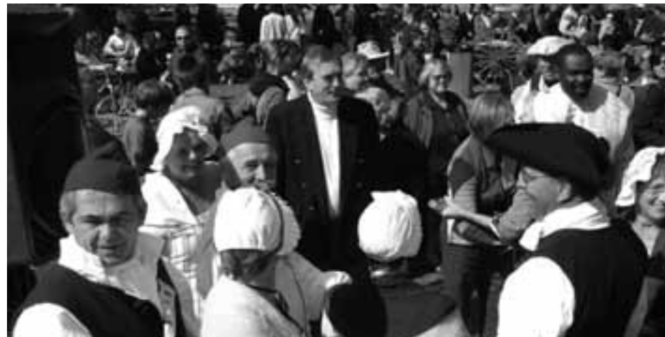
Plus de 5 000 visiteurs ont fréquenté le parc St. Mark. Beau temps, costumes d'époque, nourriture d'antan, rencontres avec des artisans passionnés, rires et convivialité étaient au rendez-vous de cette fête pour le grand bonheur des visiteurs.