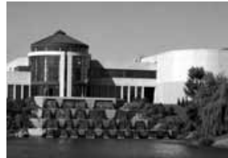
Centre d'épuration Rive-Sud

La Ville prévoit compléter l'élaboration de cette politique ainsi que ses modalités dès cet automne,