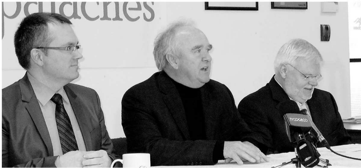
LA TRIBUNE, NELSON FECTEAU

Le développement d'une image de marque distinctive et mobilisatrice est également au menu.