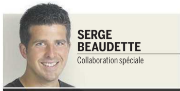
SERGE BEAUDETTE Collaboration spéciale

SHERBROOKE – Le printemps! Malgré le mètre de neige qu'il reste à certains endroits et les froids qui durent, le printemps est bel et bien de retour si l'on se fie aux oiseaux. Les Merles d'Amérique (appelé communément mais faussement «rouge-gorge»), les Carouges à épaulettes et pas moins de soixante et une espèces sont de retour au Québec, fraîchement arrivés de leurs lieux d'hivernage dans le sud.