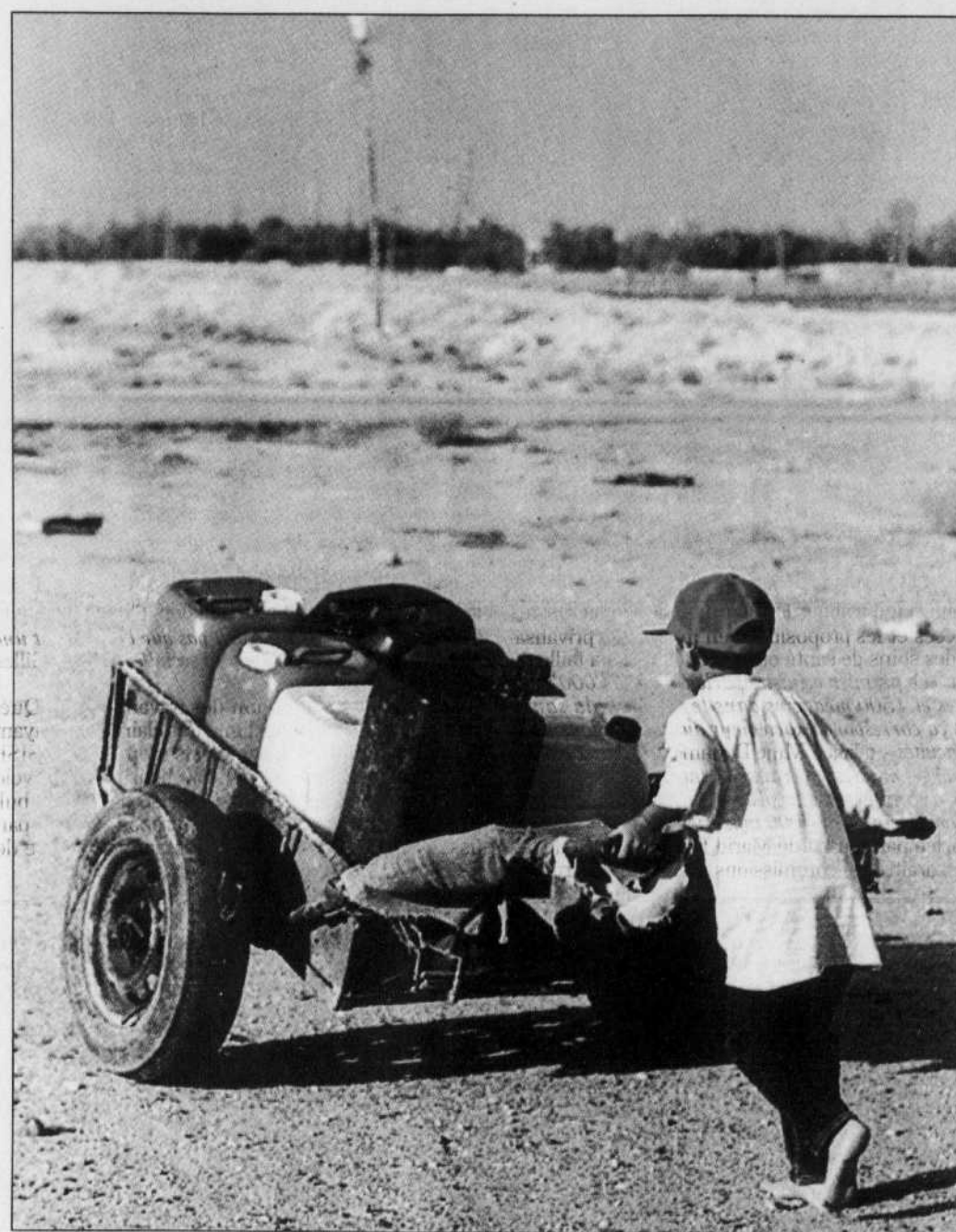
Avec le changement proposé, c'est tout le partage de la rente pétrolière qui serait bouleversé.