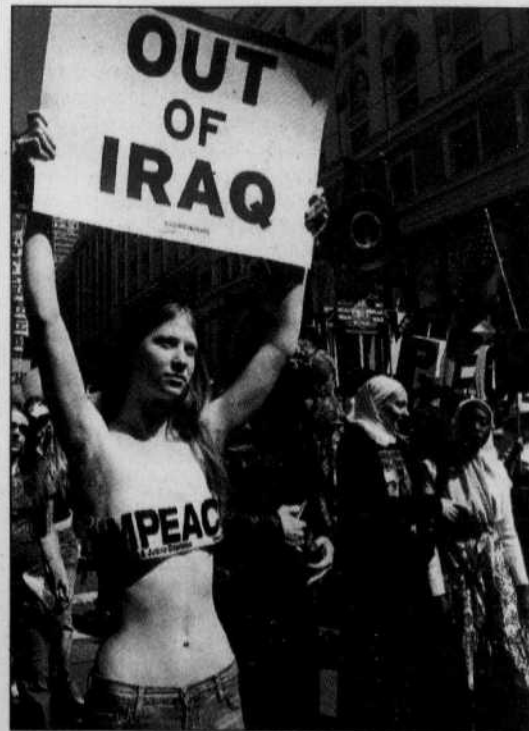
Les manifestations contre la guerre se sont poursuivies hier aux États-Unis, notamment à New York et à San Francisco (notre photo).