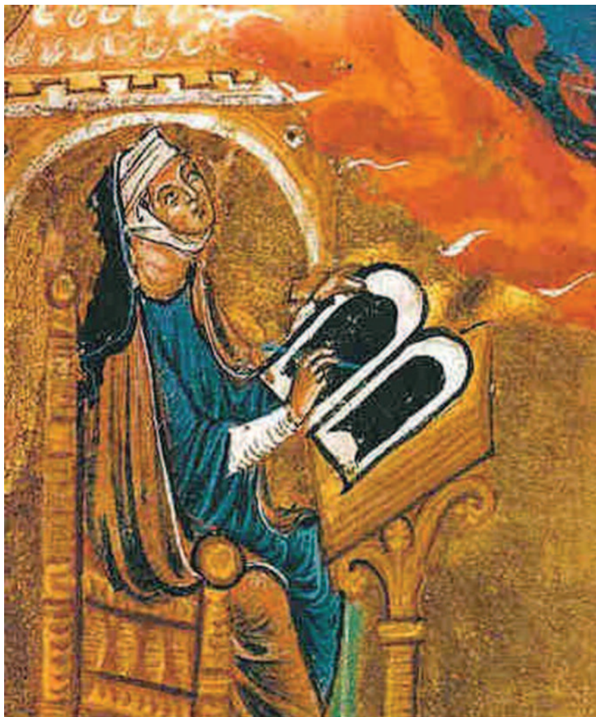
L'inspiration divine d'Hildegarde de Bingen, enluminure médiévale.

Parmi ses œuvres, on dénombre au moins quatre cents lettres et douze livres dont les principaux sont le Scivias ( Sache les voies du Seigneur ), le Livre des œuvres divines ( Visions ), Le Livre des mérites de la vie . Dans le Scivias , elle retrace l'histoire de la création, du salut et de la fin des temps. Elle développe une théologie cosmique, où l'amour de Dieu envers sa création occupe une place importante. L'abbesse applique dans son œuvre le concept de viriditas 3 à la nature