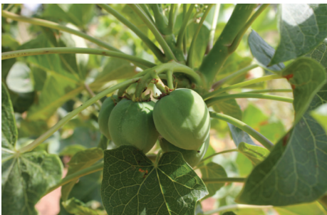
Fruit du jatropha - Crédit photo : Pascal Vallières (2012)

À l'instar de plusieurs pays africains non producteurs de pétrole, le Mali a misé, à partir de 2007, sur la production de biocarburants afin d'améliorer sa sécurité énergétique et de diminuer les coûts liés aux importations d'hydrocarbures. Le pays a ainsi fondé ses espoirs sur le jatropha, une plante oléagineuse pérenne et non comestible qui produit une huile dont les composés sont exploitables pour l'électrification rurale et la production de biodiesel (1) . Le choix de cette culture énergétique a été fait à une période où le jatropha bénéficiait d'un engouement à l'échelle globale en raison des annonces de rendement élevé et d'une prétendue capacité à pousser sur des terres marginales, avant que des rendements décevants ne viennent briser cette image de plante miracle (2) .