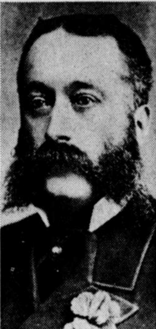
M. Théodore Robitaille, lieutenant-gouverneur de la province de Québec de 1879 à 1884.

Après la Confédération, en 1867, Théodore Robitaille re-