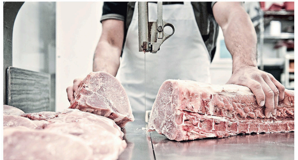
La direction d'Olymel estime que la conjoncture de marchés exige une plus grande agilité dans l'atteinte des objectifs stratégiques de l'entreprise.

« La révision des fonctions des employés-cadres s'ajoute à la réorganisation que nous avons entreprise depuis plus d'un an dans le secteur du porc frais compte tenu de l'incertitude