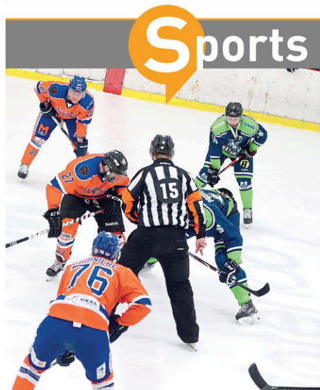
Les équipes de Farnham et de Waterloo s'affrontent pour la toute première fois de la saison, samedi, à l'aréna Madeleine-Auclair.