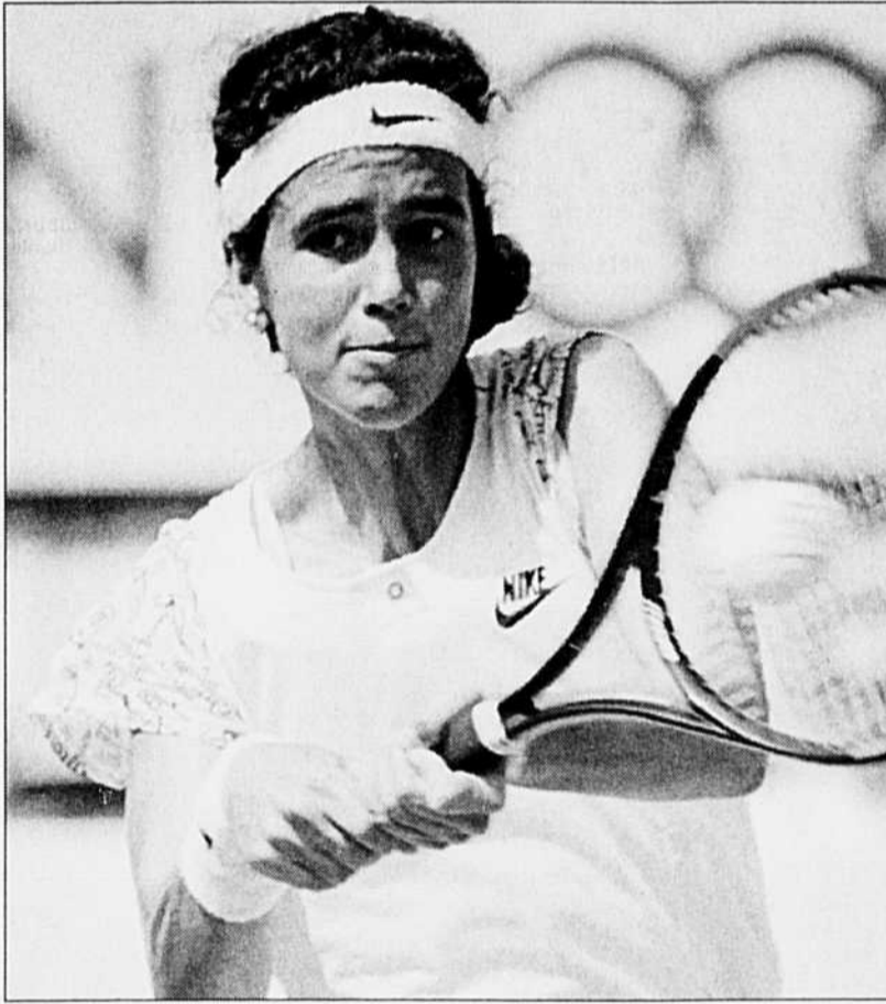
L'Américaine Mary Joe Fernandez a vaincu en deux manches de 6-2 et 7-6 l'Autrichienne Judith Wiesner en huitième de finale du tournoi de Berlin.

Le vainqueur des tournois d'Estoril et Barcelone en avril dernier faisait grise mine: «J'ai essayé d'attaquer mais j'ai mal joué. J'ai appris beaucoup de ce match et j'espère qu'un autre comme celui-ci ne se reproduira jamais plus...»