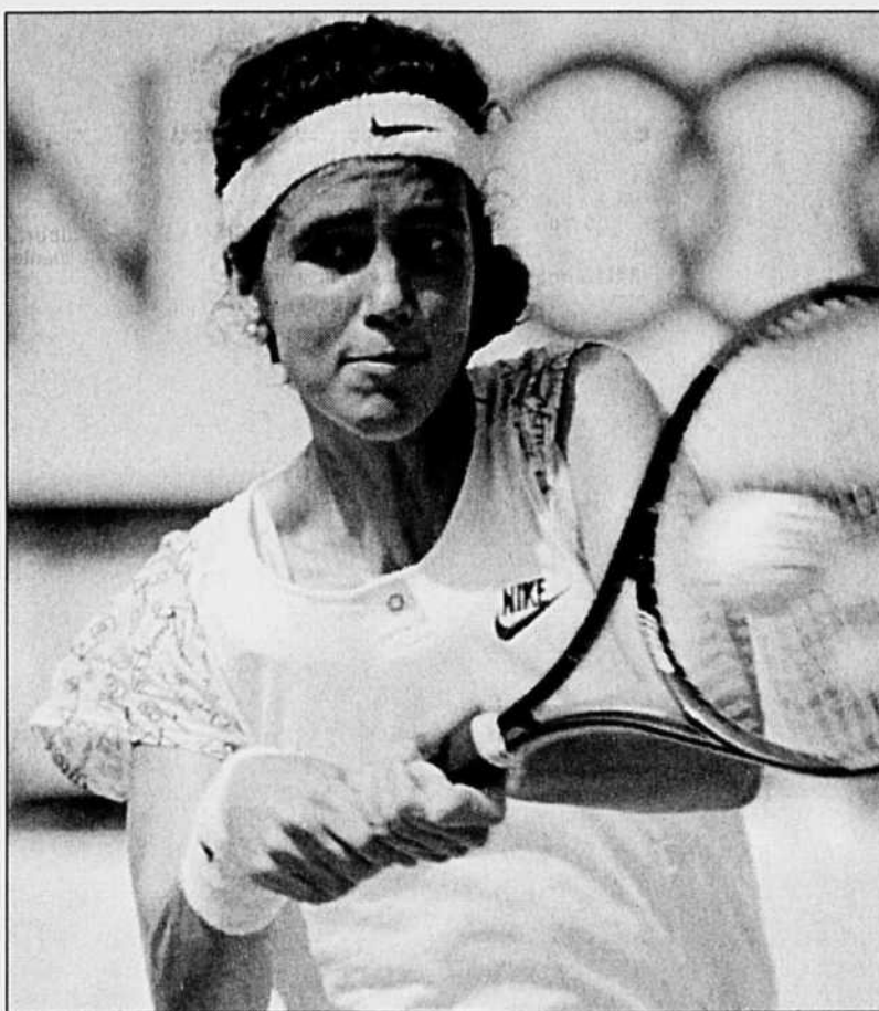
L'Américaine Mary Joe Fernandez a vaincu en deux manches de 6-2 et 7-6 l'Autrichienne Judith Wiesner en huitième de finale du tournoi de Berlin.

Le vainqueur des tournois d'Estoril et Barcelone en avril dernier faisait grise mine: «J'ai essayé d'attaquer mais j'ai mal joué. J'ai appris beaucoup de ce match et j'espère qu'un autre comme celui-ci ne se reproduira jamais plus...»