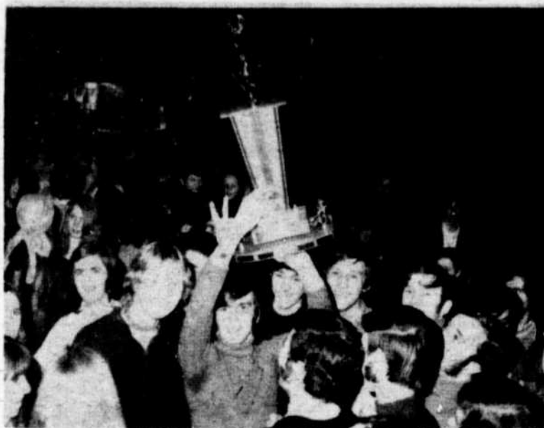
AU BALLON BALAI:

Les équipes de la Polyvalente ont participé à différentes compétitions tant provinciales, régionales que locales. Nous offrons à nos lecteurs une rétrospective photographique des événements récents qui ont eu lieu dans ce domaine.