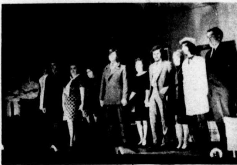
"L'équipe de 'Bouzille et les Justes'"