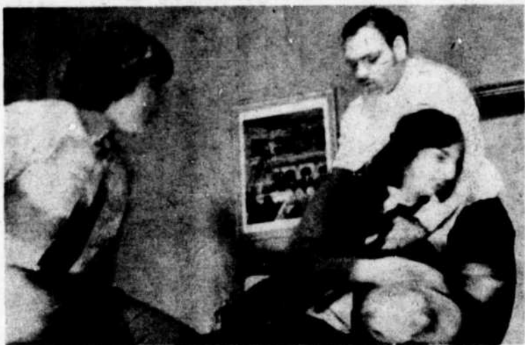
Vas-tu enfin comprendre Bouzille ---