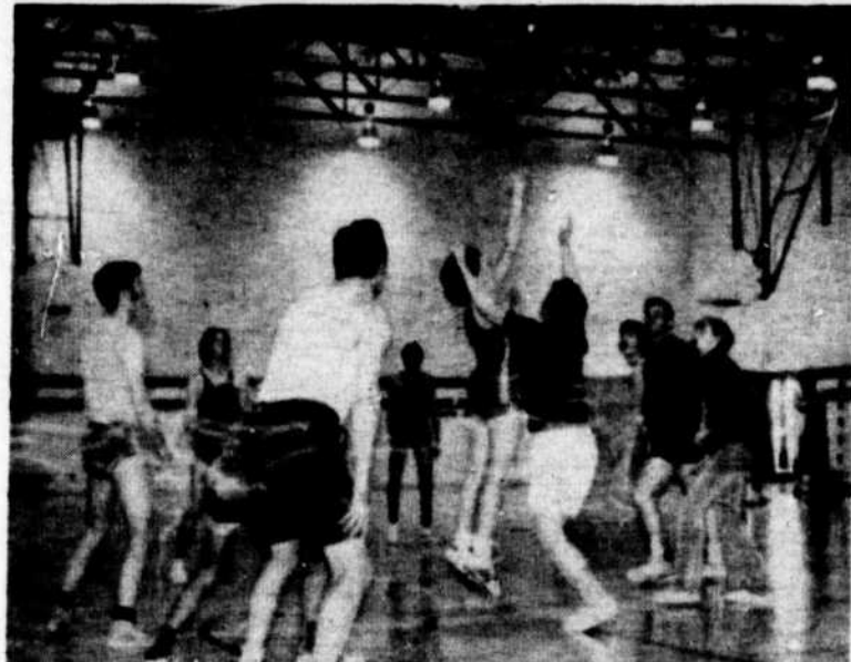
TOURNOI BALLON PANIER:

C'est DIMANCHE LE 28 MARS qu'a lieu le tournoi de ballon panier régional à la Polyvalente de Hull. Quelques équipes masculines et féminines de l'école participent dans les catégories intermédiaire et junior.