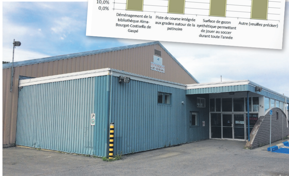
Ce sont 46,9% des répondants qui croient que l'aréna devrait rester au centre-ville alors que 43,7% pensent qu'il pourrait être à un autre endroit.