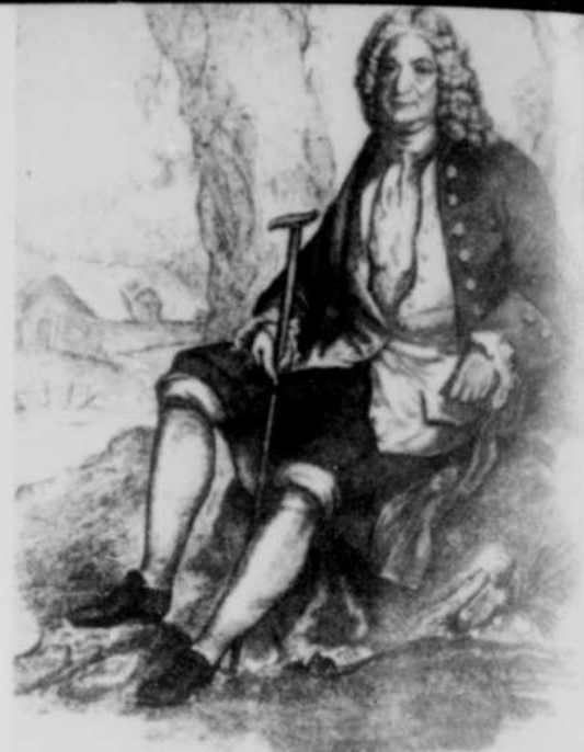
Alain-René Lesage (Portrait de Bailly)