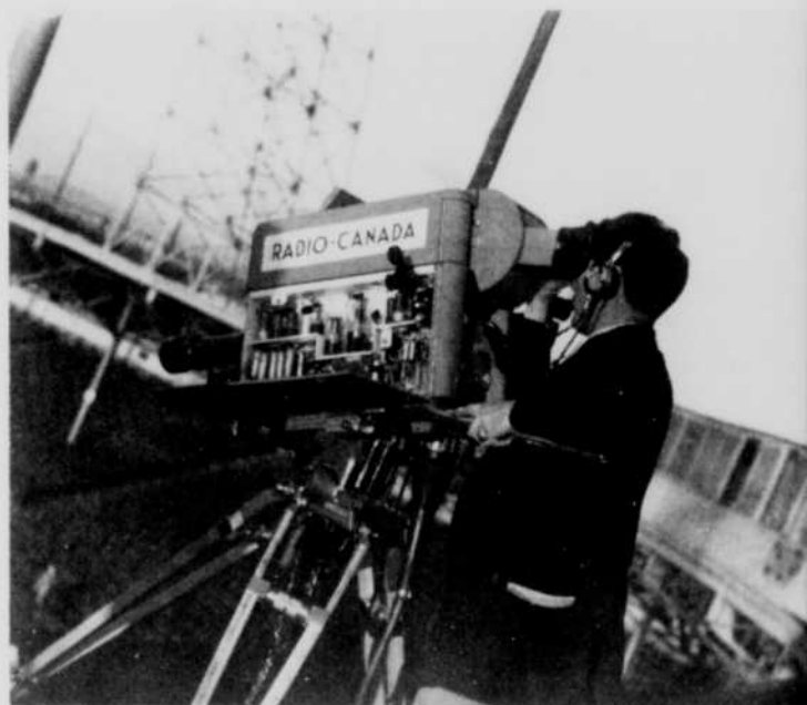
Pour suivre les évolutions des Canadiens, les prouesses des Royaux et, en général, tous les mouvements des athlètes du sport, il faut au cameraman sûreté de coup d'oeil, rapidité de réflexes, connaissance parfaite du jeu, jugement sûr et, naturellement, la maîtrise de son métier, condition "sine qua non" de son habileté.