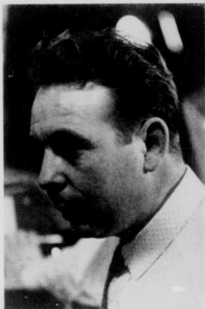
Adelin Bouchard, réalisateur de "La vie qui bat"

Evidemment, il y a des risques à prendre, même si le réalisateur s'assure d'un maximum de prudence. Il y a toujours l'imprévu. Ainsi, lors d'une émission récente, le léopard, retenu seulement par une corde, aperçut le chevreuil, en liberté à l'autre bout du