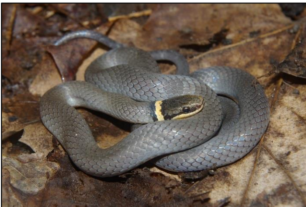
Couleuvre à collier