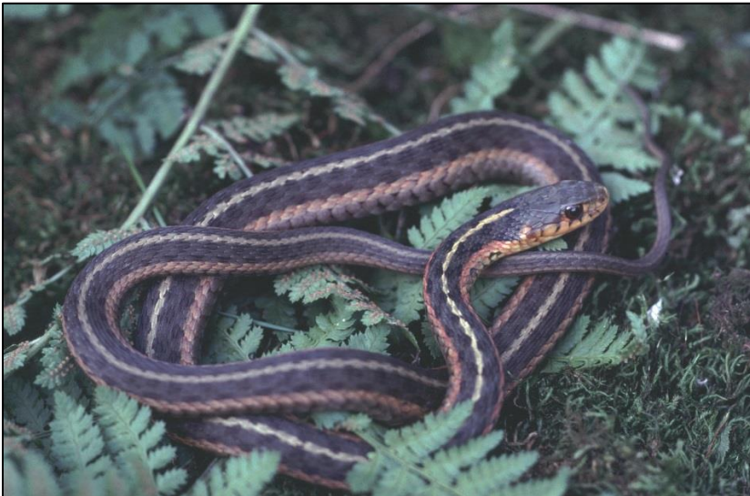
Couleuvre rayée