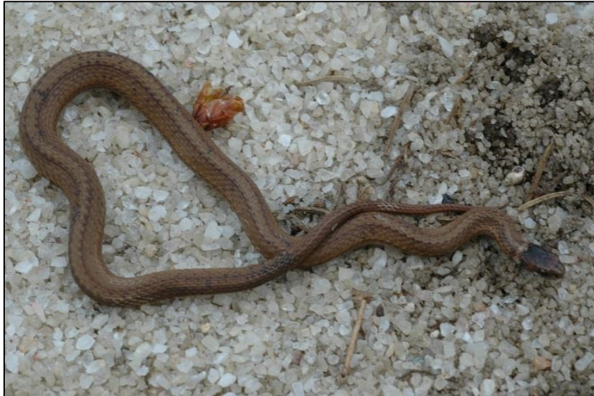
Figure 3. Couleuvre à ventre rouge juvénile