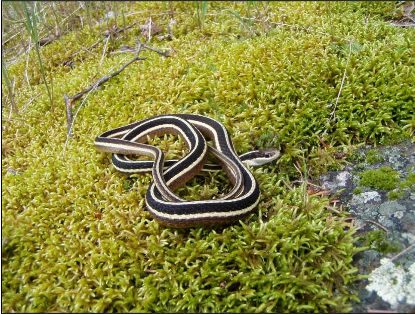
Couleuvre mince