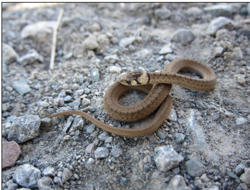
Figure 4. Couleuvre brune juvénile