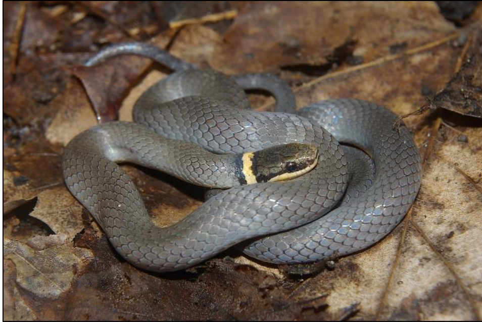
Figure 5. Couleuvre à collier