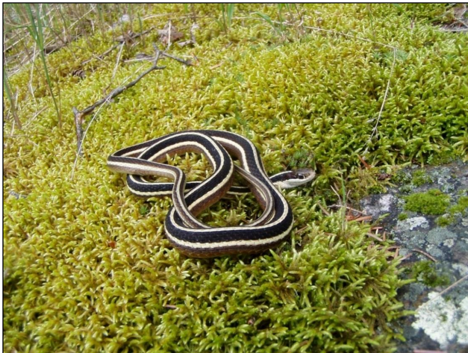
Figure 6. Couleuvre mince