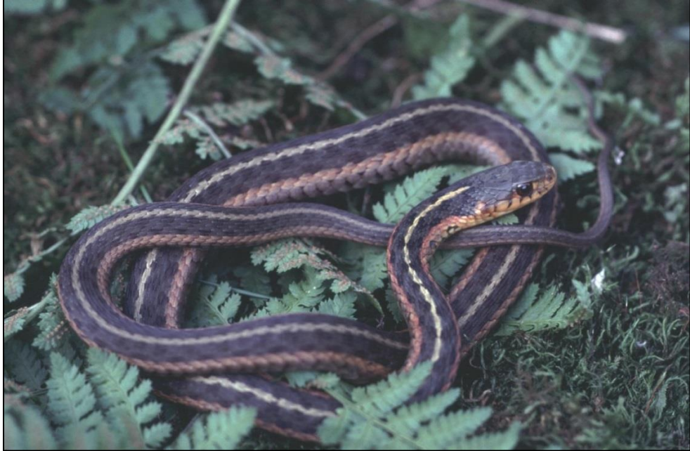
Figure 7. Couleuvre rayée