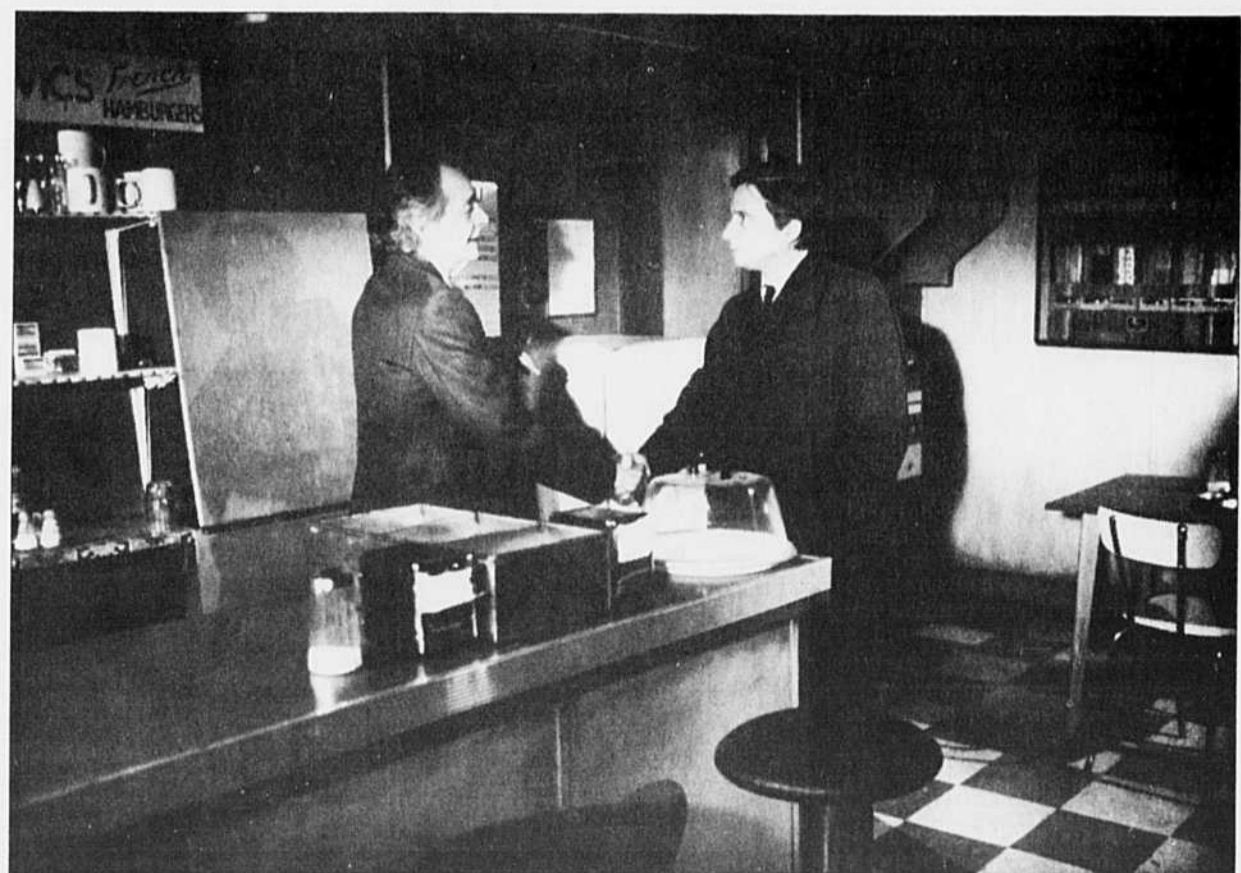
Serge Reggiani et Jean-Pierre Léaud dans J'ai engagé un tueur .