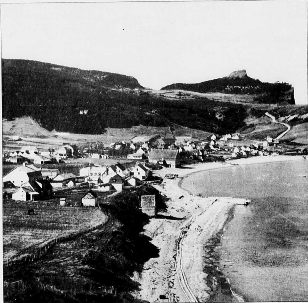
Une paysage typique de la Gaspésie, près de Percé.

Des évolutions paradoxales se sont manifestées. Dans les espaces ruraux les plus éloignés, on a l'impression d'une évolution où dévelop-