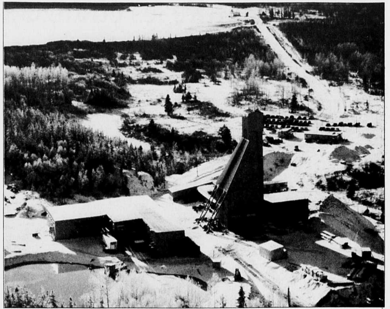
La société minière Cambior, spécialisée dans l'extraction aurifère.

Le Québec pourra-t-il donc faire face à cette mondialisation de l'exploitation des ressources minières ? Pour Normand Ouimet, il y a qu'une façon de rentabiliser davantage nos activités minières pour demeurer compétitif sur le marché international, c'est en réduisant les coûts d'ex-