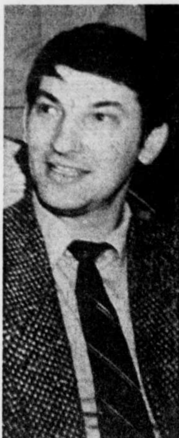
Page 4 Vladislav Tretiak

♦ Jacques Plante demeure le plus grand des grands gardiens de but pour Vladislav Tretiak qui n'a jamais caché son admiration pour Plante. Notre journaliste Réal Labbé nous rapporte les propos tenus par le gardien de but vedette des Soviétiques, au tournoi olympique de Calgary. Aujourd'hui, Tretiak, ambassadeur de Rendez-Vous 87, est de passage à Québec en compagnie de son épouse.