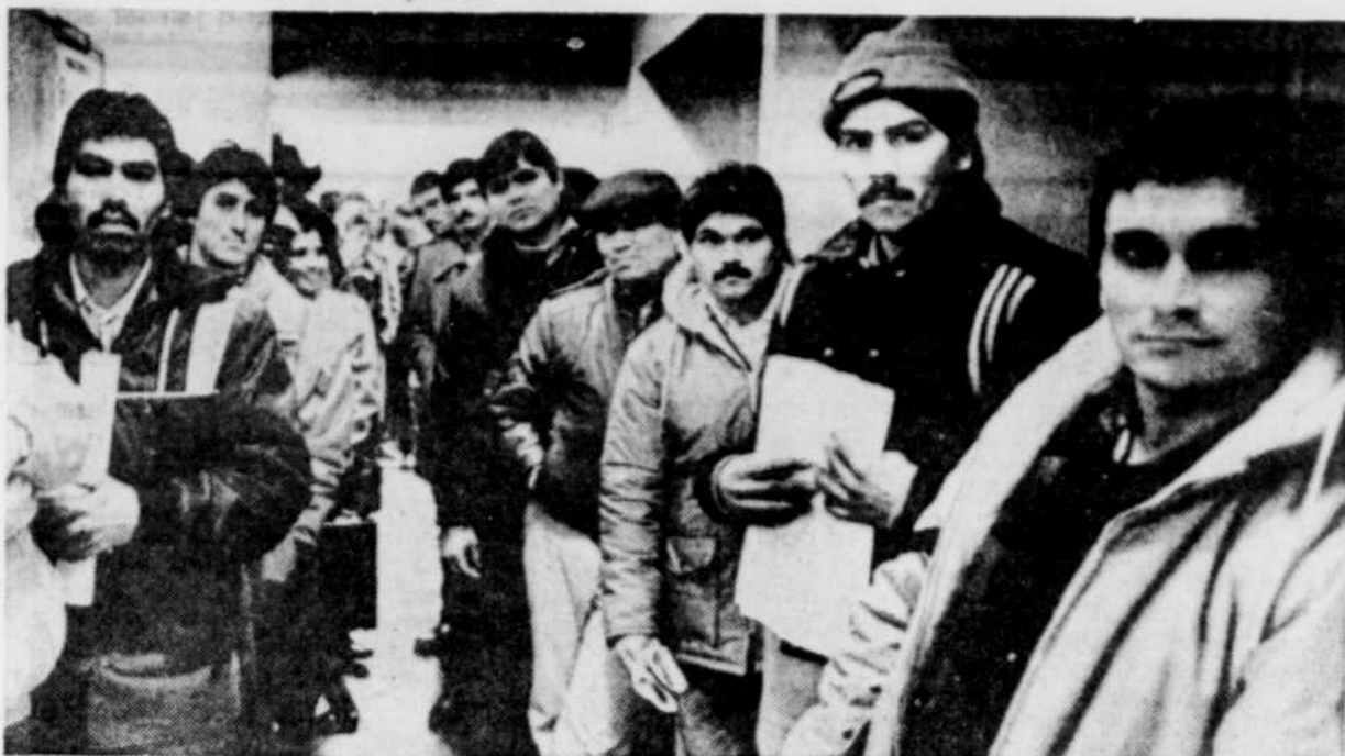
Pas moins de 250 personnes faisaient le pied de grue, hier, dans les couloirs de l'immeuble du ministère des Communautés culturelles et de l'immigration, pour obtenir un statut de réfugié.