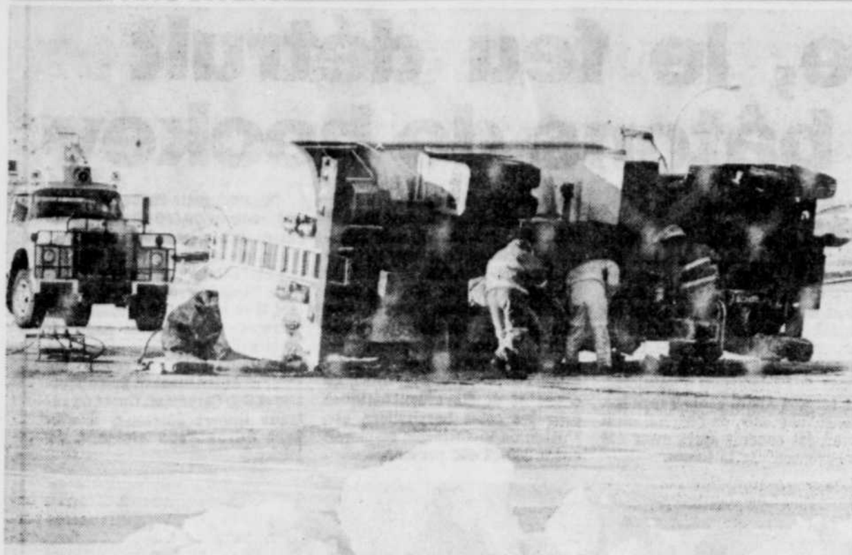
Il a quand même fallu de longues heures pour récupérer les 13,500 litres de jet fuel et relever le camion. Personne n'a été blessé.