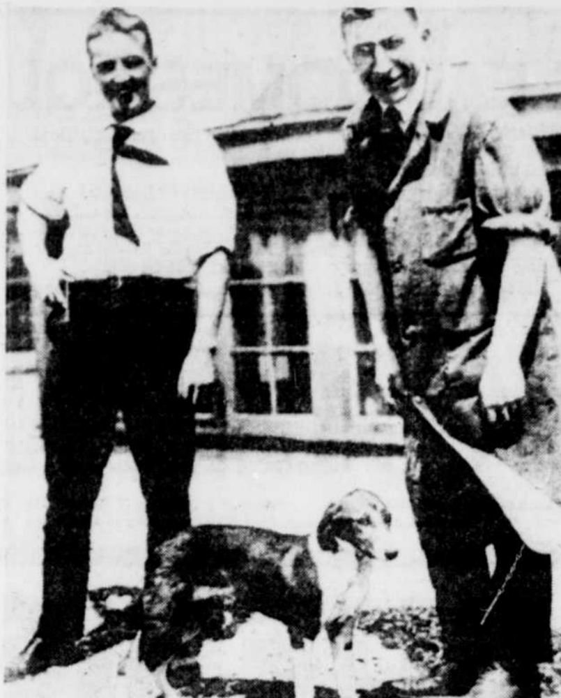
Charles Best, un assistant de recherche originaire du Maine (à gauche) et Sir Frederick Grant Banting, un Ontarien, posent en compagnie d'un de leurs chiens de laboratoire, peu après leur historique découverte, à l'université de Toronto, en 1921.

De source médicale, on indique cependant que l'opération subie par les cinq hommes est un acte tout à fait courant qui consiste à vider le sein de sa substance mammaire. On souligne en outre que les cas ne sont pas suffisamment nombreux pour en tirer des conclusions, mais l'on n'en pose pas moins des questions sur une éventuelle responsabilité des produits utilisés dans le traitement de la vigne. ●