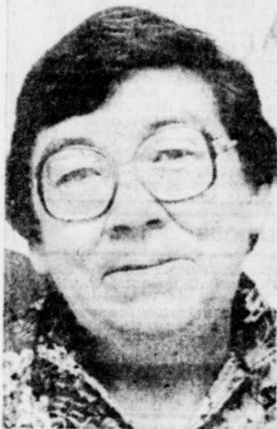
Margaret Laurence dans une photo récente.

ners, le quatrième volume de la saga de Manawaka, en 1974, que Margaret Laurence a attiré l'attention. Des groupes religieux fondamentalistes ainsi que des membres de commissions scolaires avaient en effet réclamé le bannissement du livre dans les bibliothèques scolaires, après avoir été offensés par certaines scènes sexuelles du roman un peu trop réalistes.