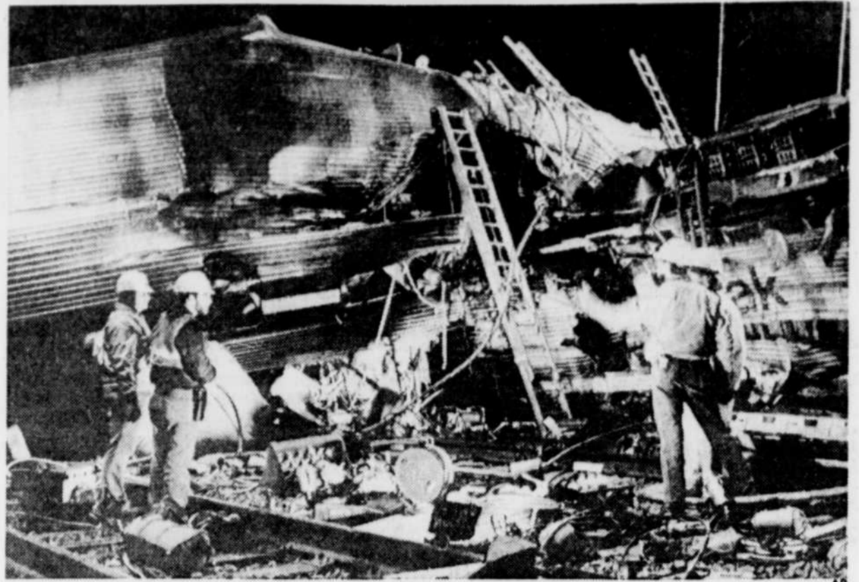
C'est d'un tel amas de ferraille que les secouristes tentent toujours de dégager les quelques cadavres qui peuvent encore s'y trouver. La collision de dimanche a fait au moins 15 morts et 175 blessés. Aucun Canadien, semble-t-il, ne se trouvait à bord.

LONDRES (AFP) — Harold Macmillan, l'ancien premier ministre conservateur décédé le 29 décembre dernier à l'âge de 92 ans, a été enterré hier dans sa paroisse de St Giles à Horsted Keynes (Sussex, sud de l'Angleterre). Conformément à son choix, le cercueil, avait été recouvert de fleurs jaunes et blanches provenant du jardin de sa résidence de Birch Grove. Deux cents personnes environ, dont la première ministre Margaret Thatcher et l'ancien premier ministre Edward Heath, ont assisté à l'enterrement.