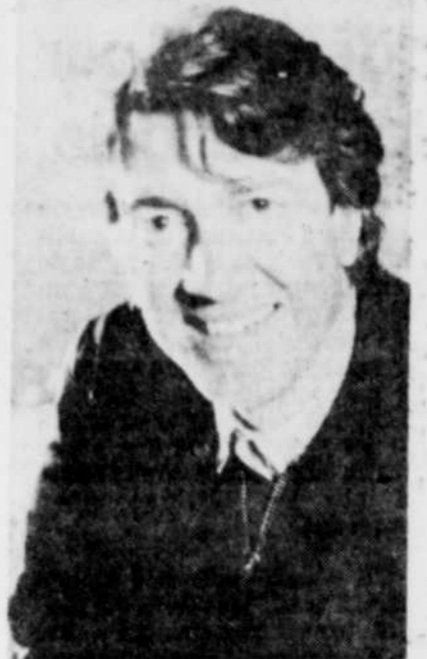
David Lynch a été choisi le meilleur directeur pour son Blue Velvet.

La société a attribué le titre de meilleur documentaire à Marlene de Maximilian Schell et celui du meilleur scénario à My Beautiful Laundrette.