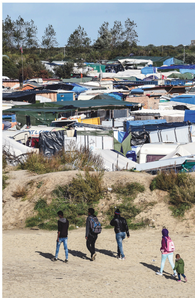
7000 migrants seront évacués de la « jungle » de Calais.

Alors que les départs de Calais vers des CAO s'opéraient, depuis octobre 2015, sur la base du volontariat, la logique va changer. Lors du démantèlement, tous les migrants seront contraints de monter dans les bus et empêchés d'en descendre avant le terminus, faute de quoi ils seront emmenés dans un centre de rétention administrative, avant d'être très vraisemblablement remis dans la nature, comme ce fut le cas pour 95% de ceux qui avaient subi le même sort lors du démantèlement de la zone sud de la « jungle », en mars... Reste toutefois à s'assurer