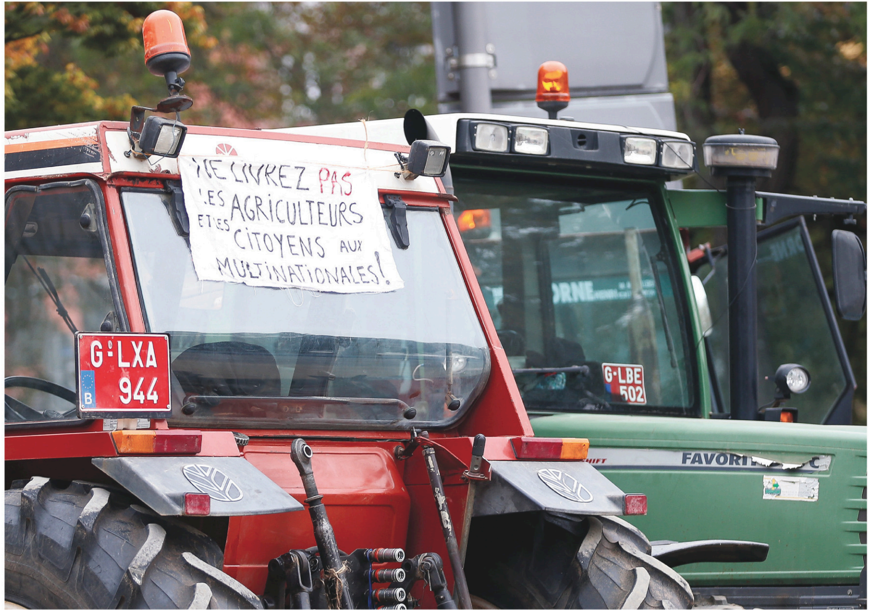
Des fermiers ont laissé leurs tracteurs devant le parlement belge à Namur à l'occasion d'une manifestation contre le libre-échange, vendredi.