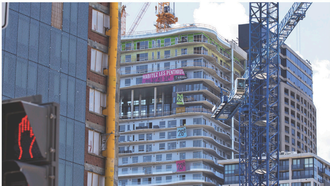
Les forts niveaux d'endettement, jumelés à la hausse des prix des maisons, sont souvent suivis de contractions de l'activité économique.

Selon M. Siddall, les pressions sur l'accessibilité nui-