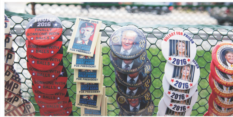
À la traîne dans plusieurs États clés, Trump est cependant le préféré dans l'Ohio.