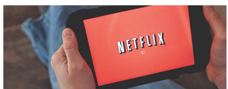
ELISE AMENDOLA ASSOCIATED PRESS

Le service de vidéo en ligne a gagné 3,2 millions d'abonnés à l'international pour la période juillet-septembre.