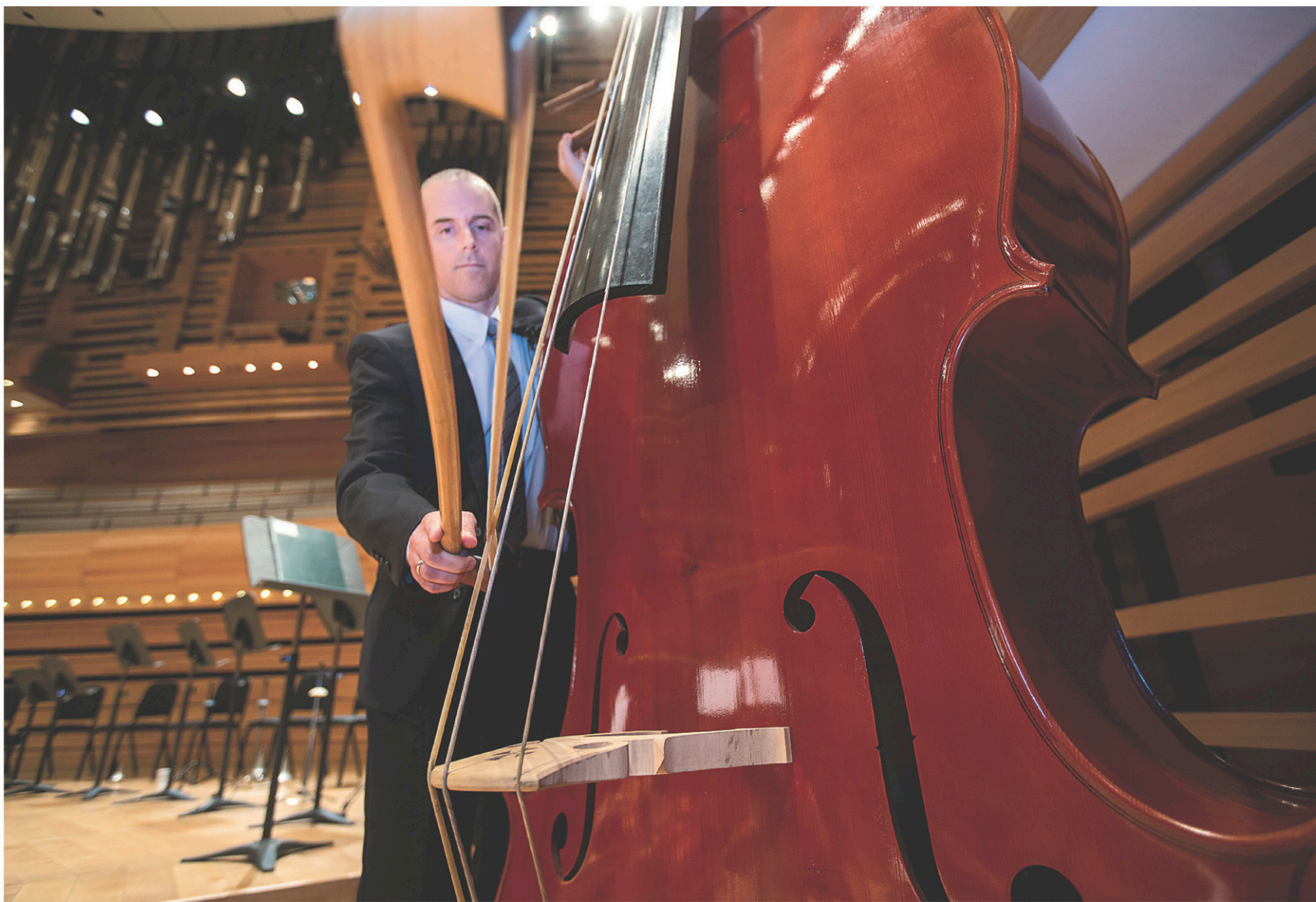
L'instrument acquis par l'orchestre mesure plus de 3 mètres de haut et pèse environ 130 kg.