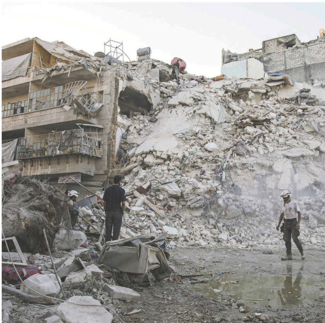
Les Casques blancs ont travaillé sans relâche lundi pour dégager des dizaines de personnes coincées sous des débris d'un immeuble à la suite d'une frappe dimanche sur le quartier de Qaterji, à Alep.