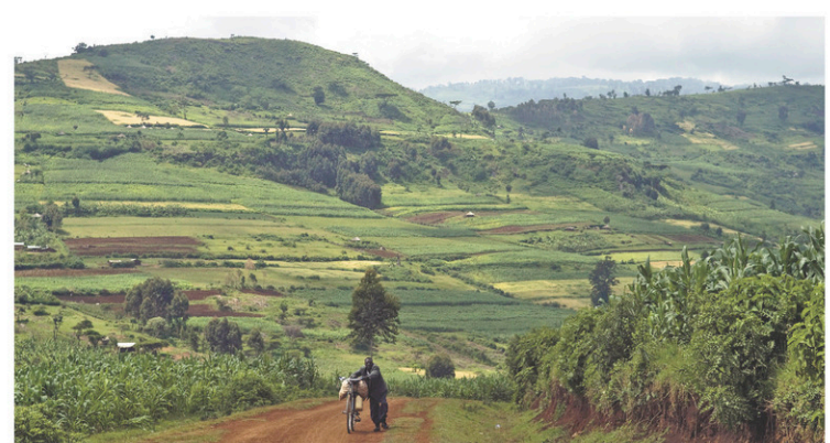
En Ouganda, le coût de l'inaction face aux changements climatiques serait de 22 à 38 milliards de dollars entre 2010 et 2050.