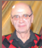
Réjean Hamelin Hockey Intronisé en 2009