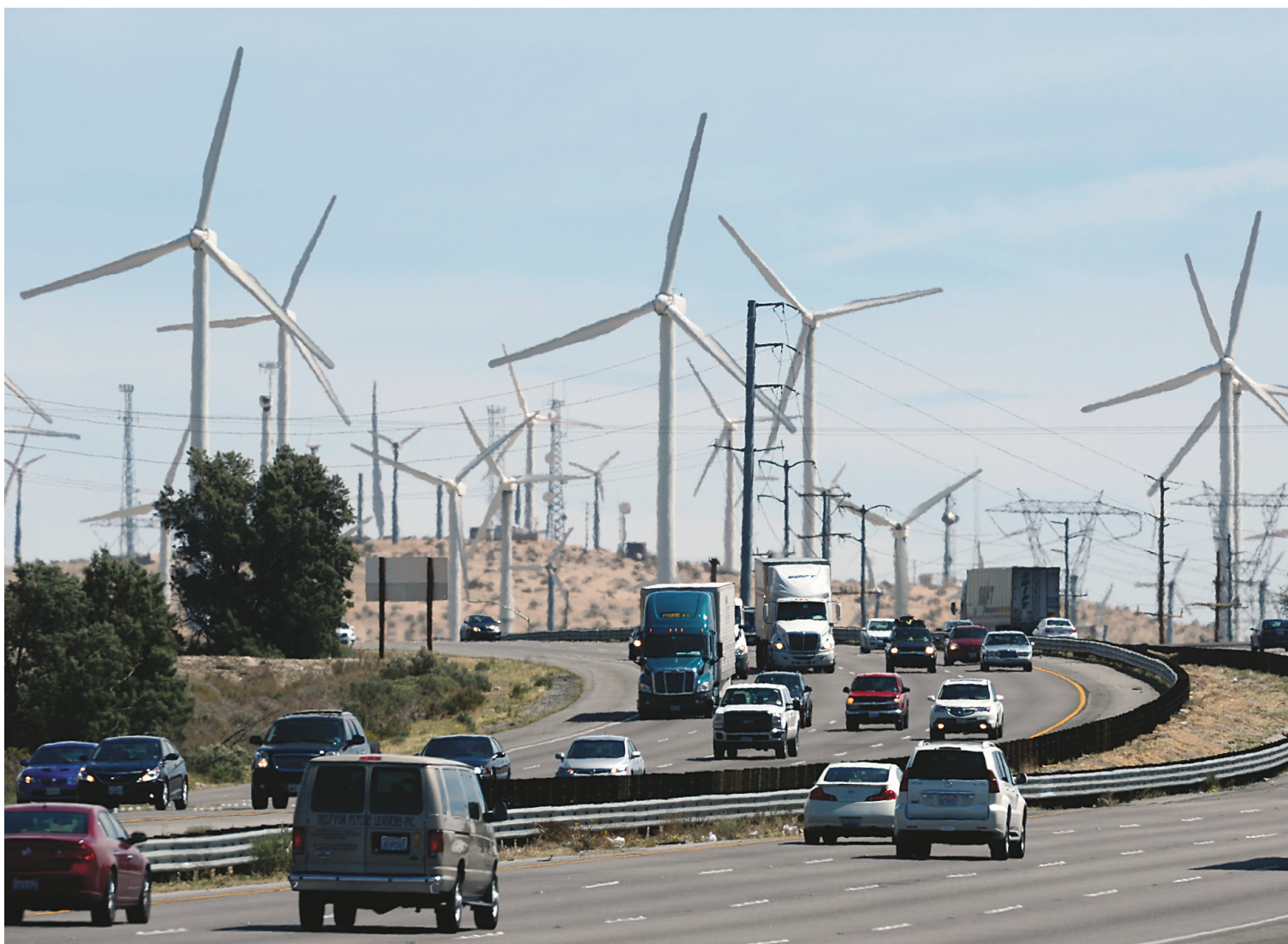
Des éoliennes semblent se dresser sur cette autoroute dans la région de Palm Springs, en Californie.