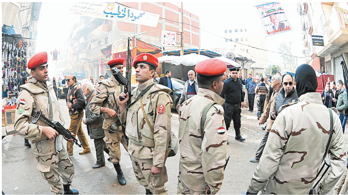
160 000 soldats et 200 000 policiers ont été déployés à travers l'Égypte pour le référendum.

Le général Sissi, vice-premier ministre, ministre de la Défense et véritable homme