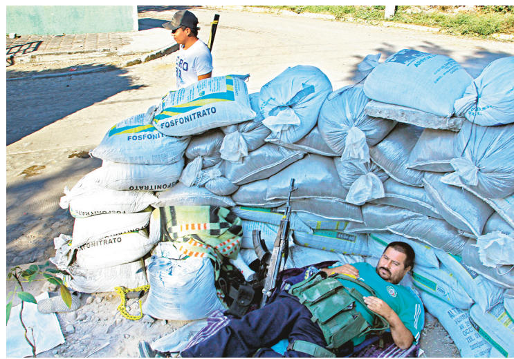
Des miliciens se reposaient mardi à Paracuaro.