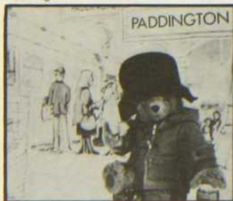
Paddington au cinéma

Voilà donc une autre fête pour petits et grands à l'antenne de Radio-Canada: Ciné-famille , le samedi 12 mai à 14 heures.