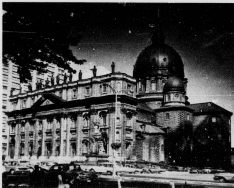
Cathédrale Marie Reine du Monde, boulevard Dorchester ouest Basilique Cathédrale Marie Reine du Monde, Dorchester Blvd West

L'autoroute panoramique des Laurentides, commencée en 1956 et terminée en 1960 jusqu'à Saint-Jérôme, part de Montréal à la sortie 17 du boulevard métropolitain, relie Montréal