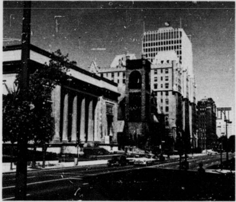
Montreal Museum of Fine Arts, Sherbrooke Street West Musée des Beaux-Arts de Montréal, rue Sherbrooke ouest

à l'Ile-Jésus, traverse la rivière des Mille-Iles jusqu'à Rosemere, puis se rend à Ste-Adèle. C'est une voie divisée avec quatre postes de péage, 67 ponts et croisements pontés.