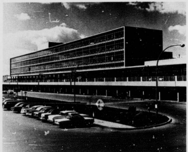
Aéroport International de Montréal, Dorval

La ville, à la fin de la lutte entre la France et l'Angleterre pour la suprématie de l'Amérique du Nord, capitula le 8 septembre 1760. Pendant la révolution américaine, la ville resta entre les mains des troupes du Congrès depuis la capitulation le 13 novembre 1775 jusqu'à son évacuation par Benedict Arnold en juin 1776. A partir de ce moment, le commerce commença à se développer: la compagnie du Nord d'Ouest, traiteurs, s'établit à Montréal en 1783-4, la "XY" en 1795-1804, et