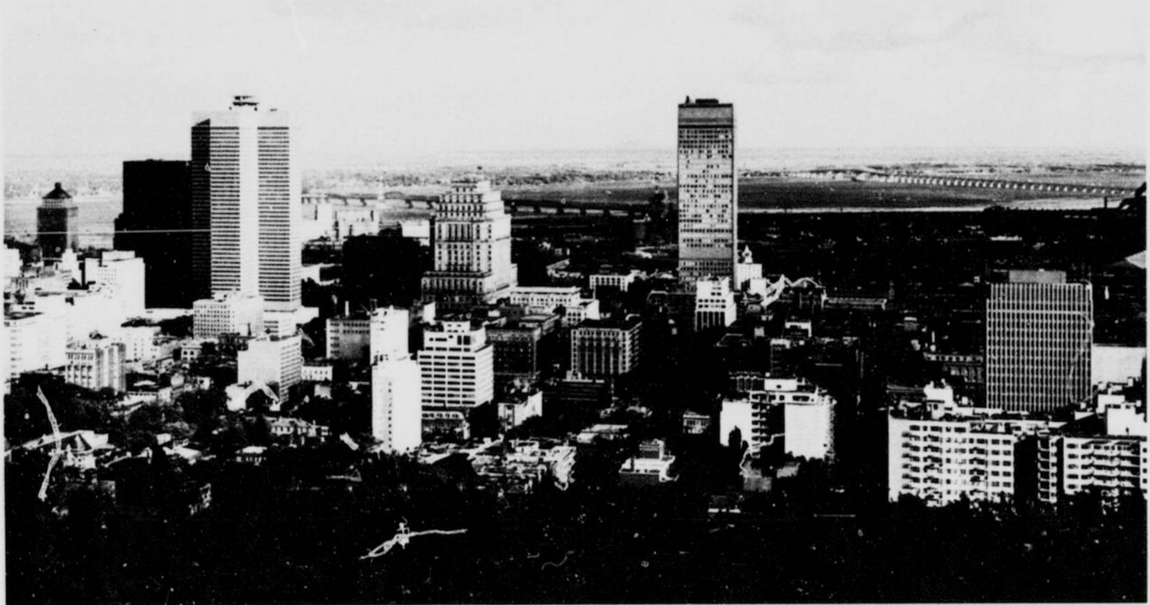
General view of Montreal from Mt. Royal