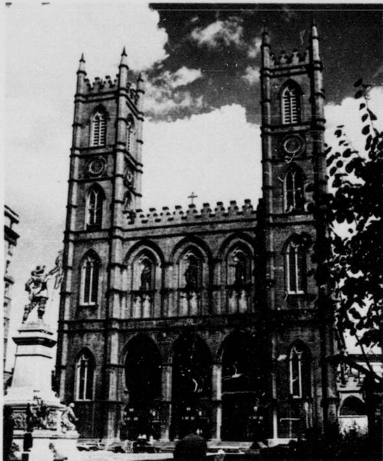
Notre Dame Church, Place d'Armes