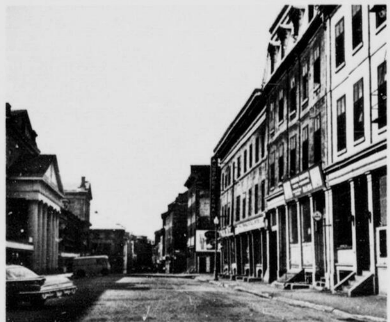
Rue St-Paul dans le Vieux Montréal St. Paul Street in Old Montreal

Montréal tire son nom de Mont-Royal ou Mont-Réal, le nom donné à cette élévation par Jacques Cartier, qui a découvert Hochelaga en 1535, l'année de son exploration du fleuve Saint-Laurent, probablement jusqu'au rapide qu'on appelle aujourd'hui Lachine. La montagne, de 769 pieds de hauteur, s'élève majestueusement au milieu de l'île qui est la plus grande du groupe d'îles formées par la rencontre de la rivière Ottawa et du fleuve Saint-Laurent. Cette île a 30 milles de longueur, 7 à 10 milles de largeur et une superficie de 194 milles carrés. La ville actuelle couvre plus de 43,734 acres ayant, par annexion, surtout en 1883, grandi de 5,000 acres qu'elle était en 1860. Sa superficie de 68 milles carrés occupe un quart de l'île.