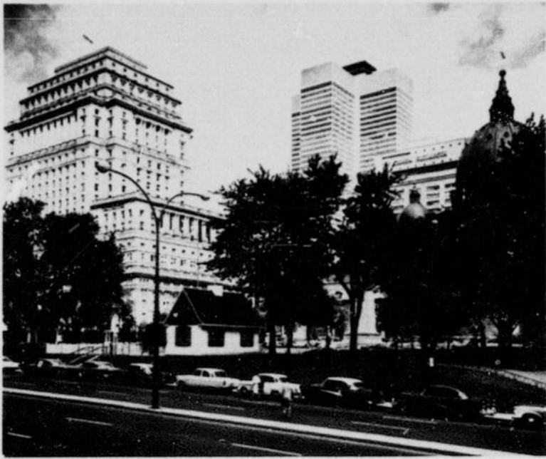
Place du Canada