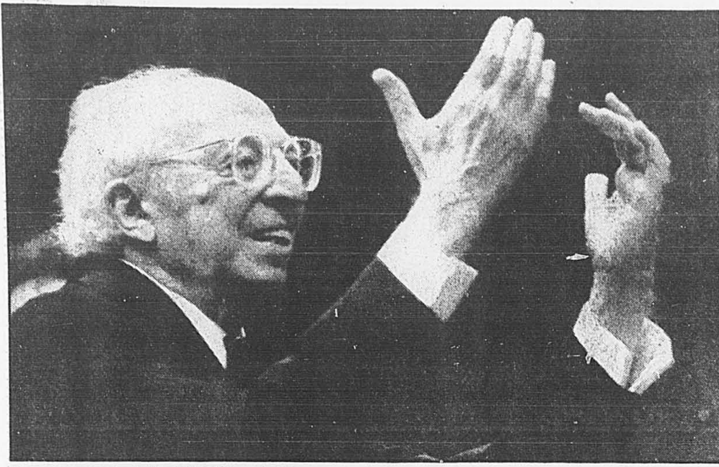
Aaron Copland est décédé à l'âge de 90 ans.