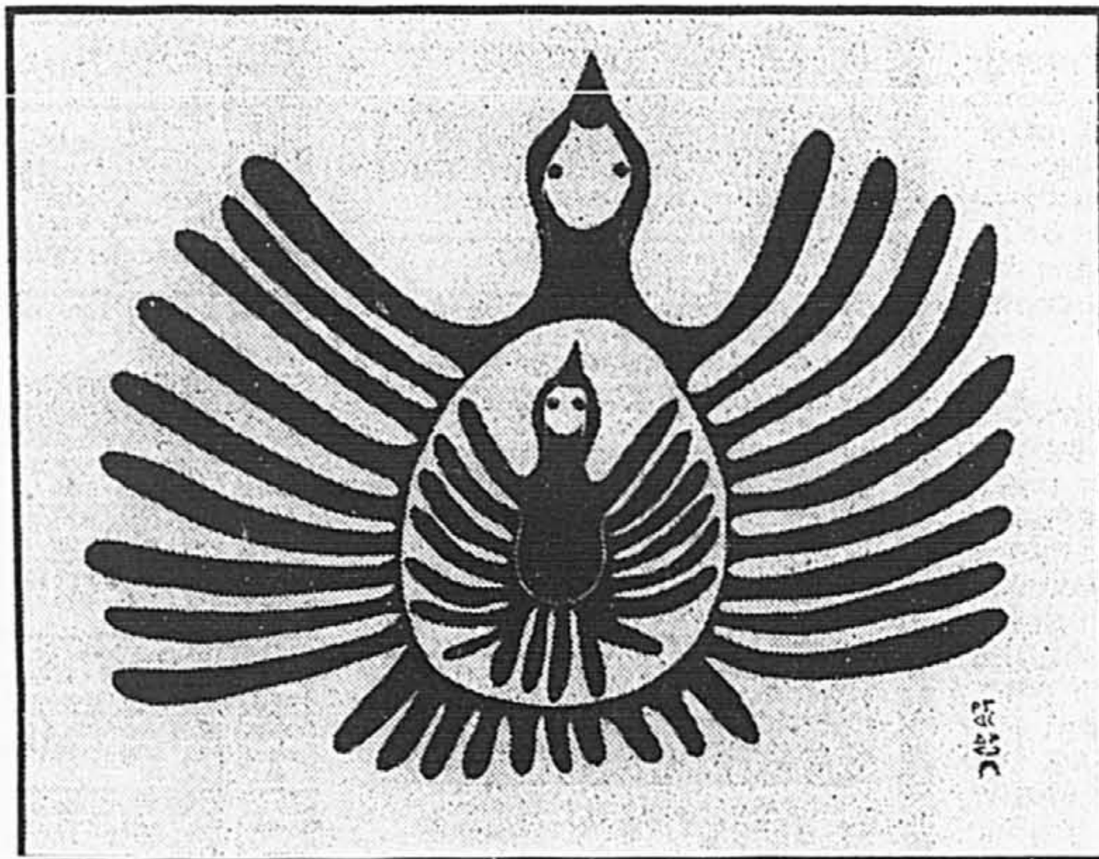
Illustration 1. KINGMEATA, Inuit, Cape Dorset, né près de Lake Harbour en 1915, L'oiseau de la fertilité , gravure sur pierre, feuille, 61,8 x 85,9 cm, compo, 43,5 x 54,6 cm, crayon, Bird of Fertility, Dorset 1969, Stone cut, 27/50, Kingmeata . Sceau de l'artiste et de la coopérative esquimaude de Baffin Ouest Ltée dans le coin inférieur droit, Musée des beaux-arts de Montréal, achat 1971, legs Horsley et Annie Townsend.

Savez-vous que beaucoup d'Inuit sont des artistes très doués? Ils font des sculptures, des dessins et des gravures depuis bon nombre d'années. Voici les illustrations de deux exemples de leur art provenant de la collection du Musée des beaux-arts de Montréal. L'une de ces œuvres est une gravure (ill. 1) venant de Cape Dorset, sur l'île de Baffin; l'autre est une sculpture (ill. 2) du grand nord québécois. Les deux œuvres sont produites avec une pierre que l'on retrouve à plusieurs endroits dans le grand nord: c'est la stéatite, qu'on appelle communément la pierre à savon. Dans le cas de la gravure, le dessin est ciselé sur la surface plate de la pierre; il est ensuite rempli d'encre et imprimé sur papier. Quant à la sculpture, c'est un morceau de pierre qui est gravé à l'aide de gouges et poli pour nous donner le résultat que l'on voit juste en dessous.