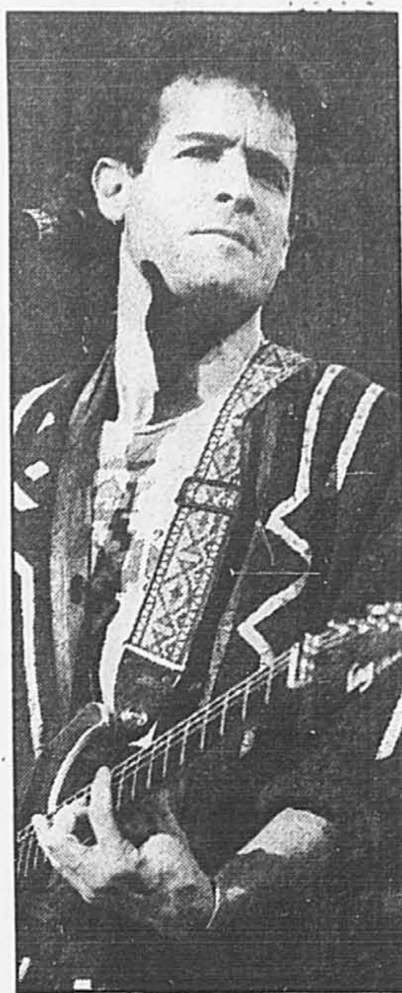
Johnny Clegg, le zoulou blanc.