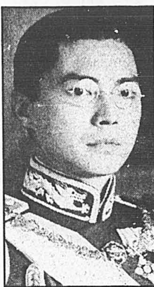
John Lone dans le rôle de Pu Yi.