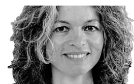
SONIA SARFATI NEW YORK

Ils ont déjà déployé leurs ailes et atterri sur d'autres plateaux de tournage depuis la fermeture de celui des « Harry Potter », qui a été leur deuxième foyer pendant plus de 10 ans. Mais pour ces enfants qui ont grandi devant les caméras et qui figurent aujourd'hui parmi les jeunes adultes les plus connus de la