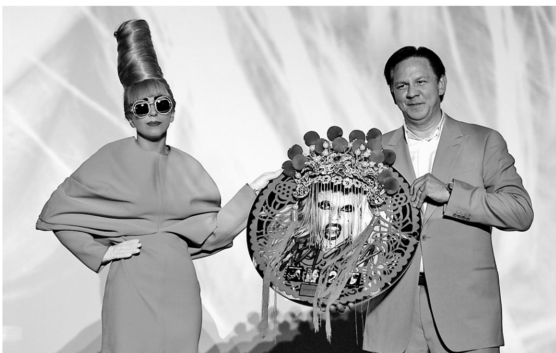
Lady Gaga, l'une des reines des ventes d'albums en 2011, avec Sandy Monteiro, de Universal Music Group.

L'industrie doit remercier ses chanteuses pour ce bon début d'année. Depuis le 1 er janvier 2011, Adele est celle qui a écoulé le plus d'exemplaires de son album, 21 (2 517 000 copies), alors que Katy Perry a vendu un nombre record de 4 120 000 exemplaires de sa chanson E.T. Pour l'instant, Adele est la seule à avoir franchi le cap des 2 millions d'albums vendus. Chez les dames, suivent Born This Way de Lady Gaga (1 540 000 exemplaires), Pink Friday de Nicki Minaj