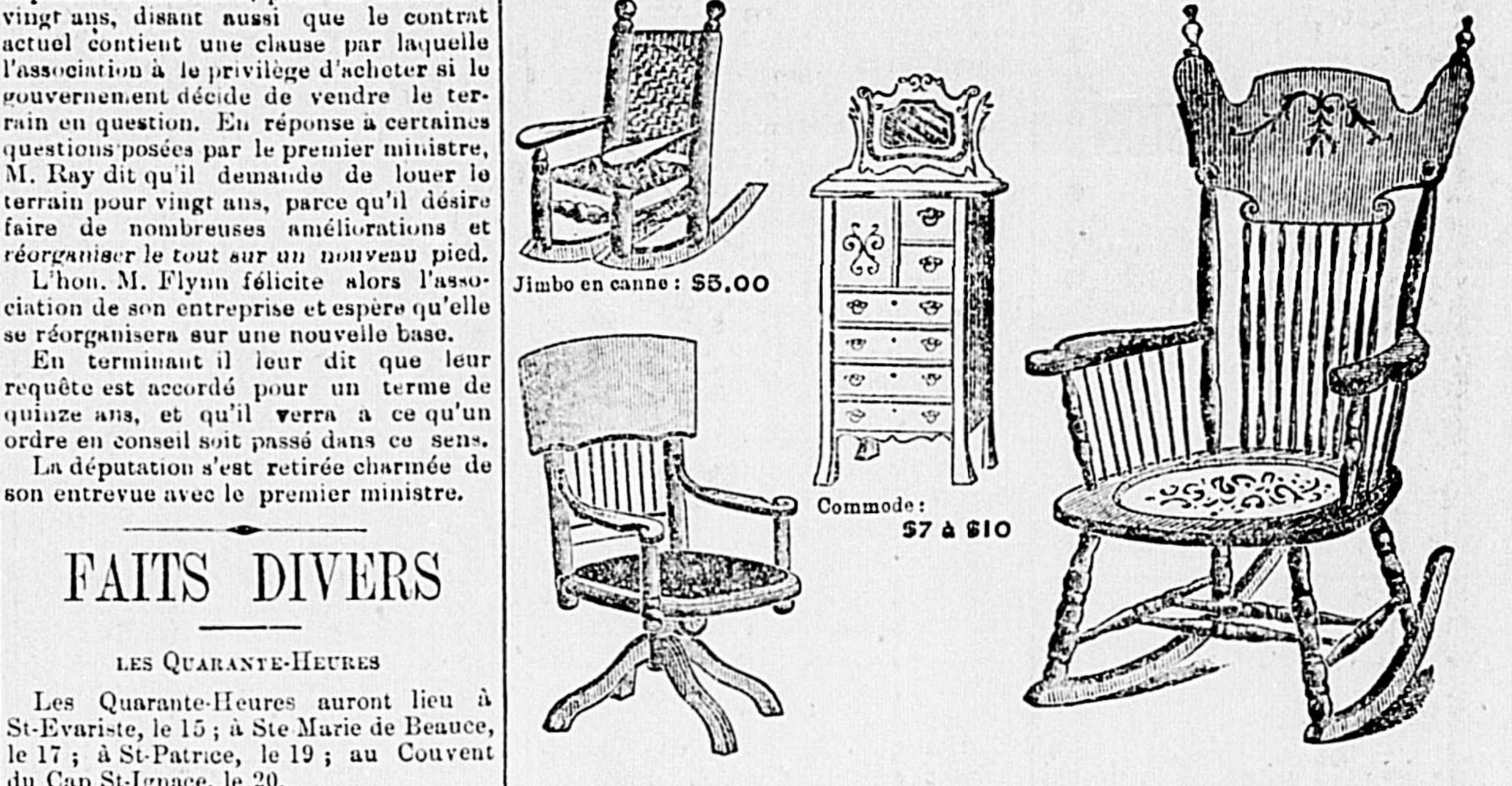
Jimbo en canne: $5.00 Commode: $7 à $10 Berceuse Cobler: $2.50 Chaise de bureau: $7.50 Bergère en Damas: 10 à $23 Pupitre d'office: $20 à $25 Bergère en Damas: $3.00

A des prix qui défient toute compétition