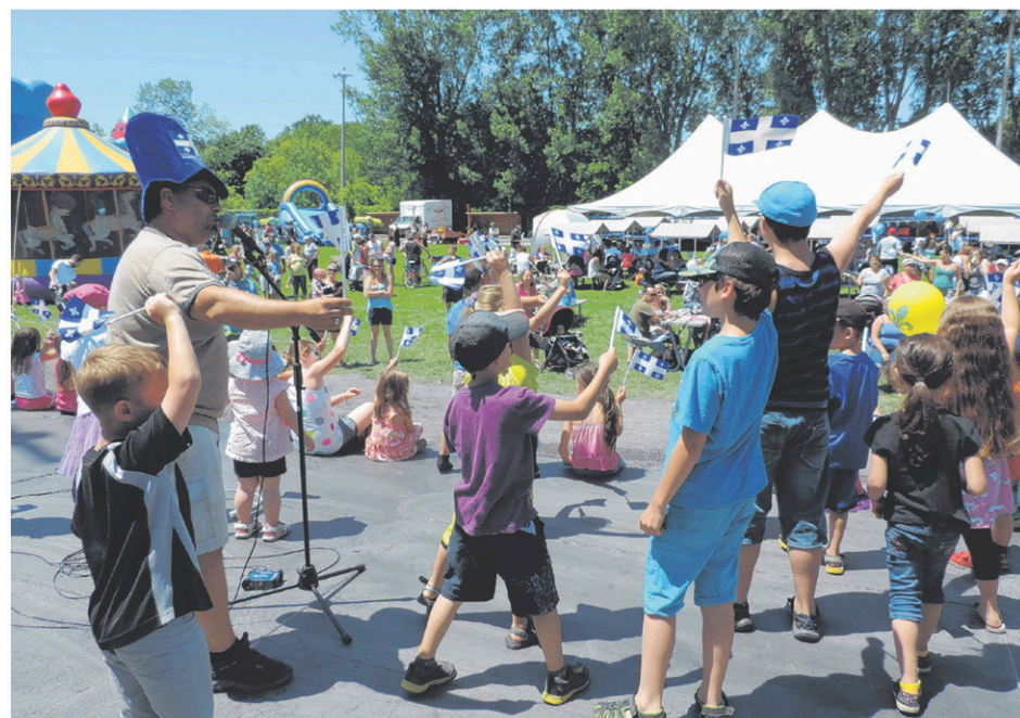
Environ 2000 visiteurs ont pris part à la journée familiale du 24 juin.

Près de 2000 visiteurs ont pris part à la journée familiale, le 24 juin. Une trentaine d'associations et d'entreprises de la région, de même que la fanfare Les Éclairs de Québec, ont participé au traditionnel défilé de la Saint-Jean-Baptiste. Sur le terrain des loisirs, animation, artistes locaux, exposants, jeux gonflables, maquillage, mini-ferme, tour de poney, restauration et confiseries ont ravi les petits et les grands.