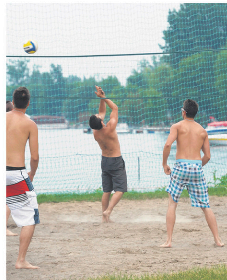
À la Marina Saint-Tropez, les participants pourront jouer au volleyball de plage.

La Fête du nautisme est organisée par l'Association maritime du Québec. Des festivités nautiques auront lieu partout à travers le Québec, les 4 et 5 juillet. Cette activité vise à démontrer l'accessibilité des sports nautiques et promouvoir le patrimoine maritime. Consultez la pro-