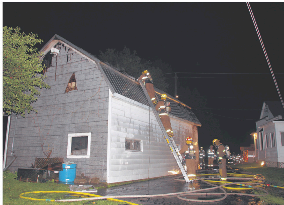
Une trentaine de pompiers ont combattu un incendie dans un garage de Saint-Jacques-le-Mineur, samedi soir.

matériels ont été limités. «Il n'y avait pas de véhicules à l'intérieur. Le premier étage n'a pas été touché par le feu», affirme Claude Brosseau.