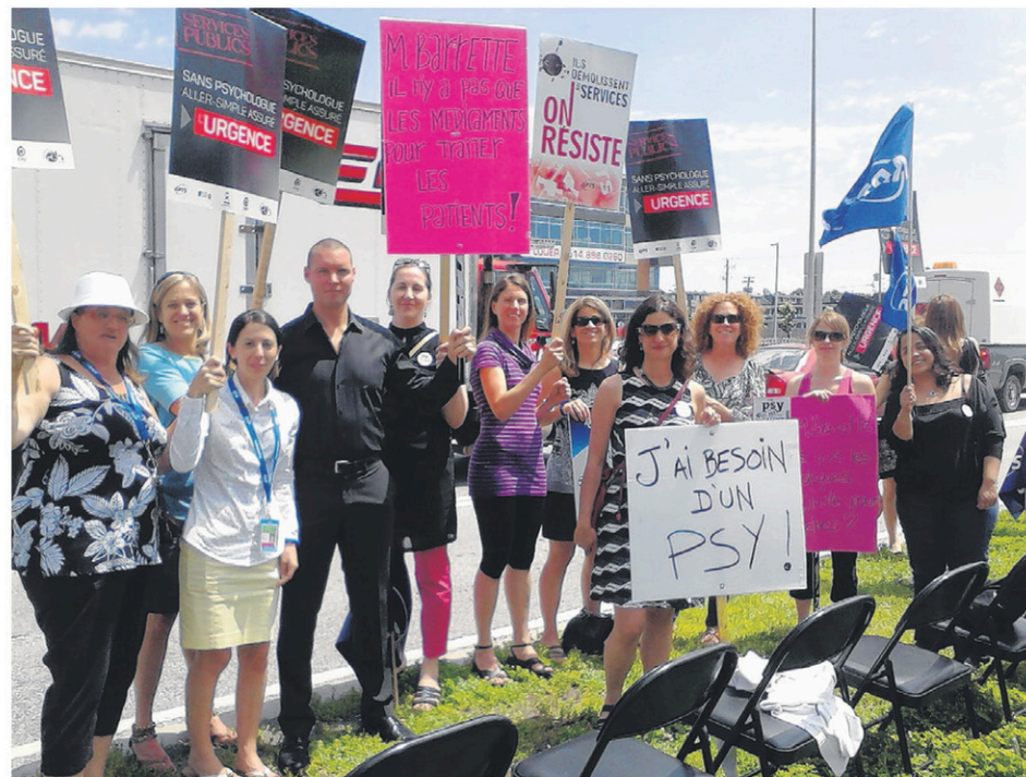
La pénurie de psychologues en CLSC crée un problème d'accessibilité pour des gens qui n'ont pas les moyens de consulter au privé, déplorent les psychologues de la région de Saint-Jean-sur-Richelieu.

«L'écart salarial entre le public et le privé est d'environ 40%. C'est énorme, déplore M. Bourque. Il n'y a pas eu d'ajustement depuis 2005, année où le doctorat est devenu obligatoire pour pratiquer. Avec une dette d'études de