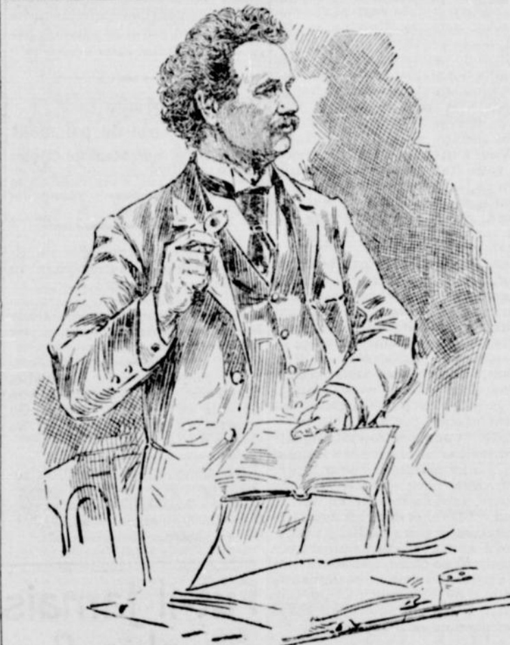
Feu M. FLAVIEN DUPONT, député du comté de Bagot aux Communes.

Il échoua aux élections générales de 1878. Elu aux communes du Canada, lors de la démission de l'hon. J. A. Mousseau, en 1882, il fut réélu par acclamation aux élections générales de 1887, de 1891 et de 1896.