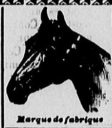
Marque de fabrique

Premier par le poids Premier par la qualité Premier par les résultats Premier sous tous rapports