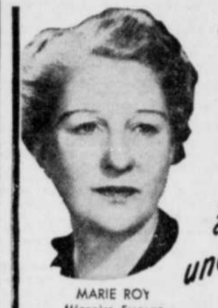
MARIE ROY Ménagère Économique

MÈRE! SOULAGEZ LA CONSTIPATION DE VOTRE ENFANT sans laxatifs désagréables au goût ou purgatifs qui donnent des crampes Les tablettes Children's Own, le nouveau correctif préparé spécialement pour les besoins des enfants en croissance, de 3 à 15 ans, sont si agréables à prendre—leur effet est si doux, évitant le plus difficile en prendre sans se faire prier. Procurez-vous des tablettes Children's Own aujourd'hui. C'est un moyen moderne de soulager la constipation de vos enfants. Dans les pharmacies.