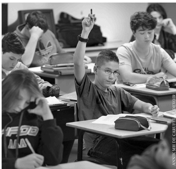
ANNIK MIE DE CARUFER LE DEVOIR

En 2014, il y avait près de 22% des élèves francophones qui fréquentaient une école secondaire privée, selon le ministère. Et, entre 1998 et 2010, le nombre de projets pédagogiques particuliers a doublé au public.