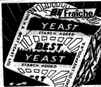
la Meilleure pour toute cuisson

Nous sommes loin des anciennes méthodes d'embauchage. En un mot, c'est du travail systématique, et non pas du travail à l'aveuglette. Le fait que le service de mise en circulation existe et fonctionne constitue une des raisons pour lesquelles les employeurs en viennent graduellement à la conclusion que le Service national de placement de la Commission est l'organisme le plus efficace qui soit dans le domaine du placement.