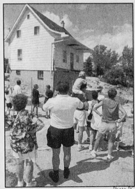
Les touristes qui sont de passage à Chicoutimi ne peuvent résister à la tentation de voir la célèbre maison qui s'est dressée contre les éléments lors du déluge de l'an dernier.

Par la suite une nouvelle altercation a éclaté. Selon la police, le jeune accusé a sorti un couteau après avoir reçu un coup de bâton. Il a poignardé profondément Rami Ranjomal à l'abdomen. Ce dernier a tenté de trouver de l'aide, mais en vain.