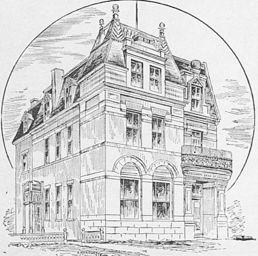
EDIFICE DE LA BANQUE DES MARCHANDS A SAINT-JEROME