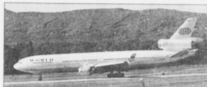
La compagnie a nolisé un avion pour ramener des passagers.