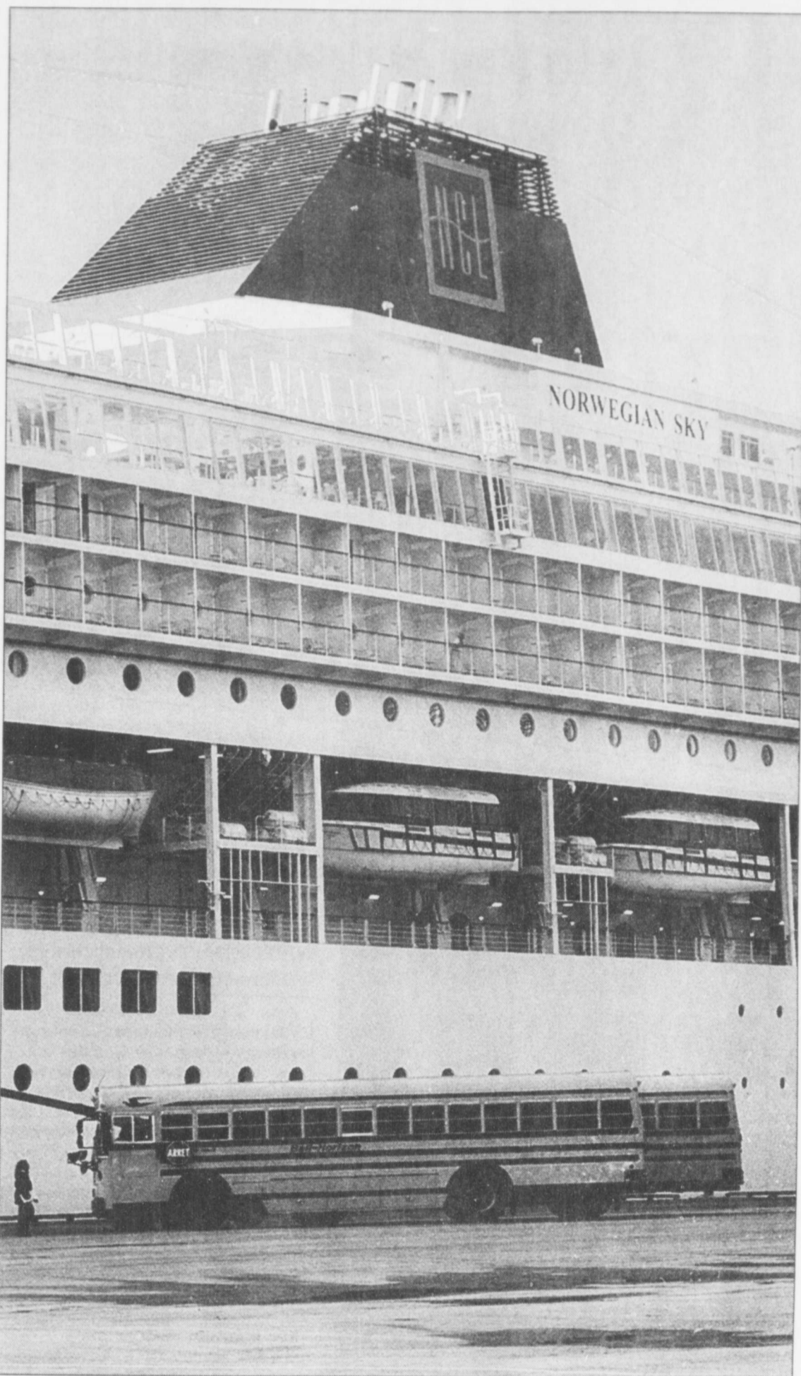
Du « Norwegian Sky » ... à l'autobus scolaire!

Le navire Tracy de la Garde côtière a aussi été très occupé samedi. Alors qu'il était à vérifier des bouées, le voilier d'un particulier s'est échoué sur les récifs de l'île Rouge au large de Tadoussac. Son propriétaire, qui voulait aller observer le paquebot de plus près, aura finalement vécu le même événement.