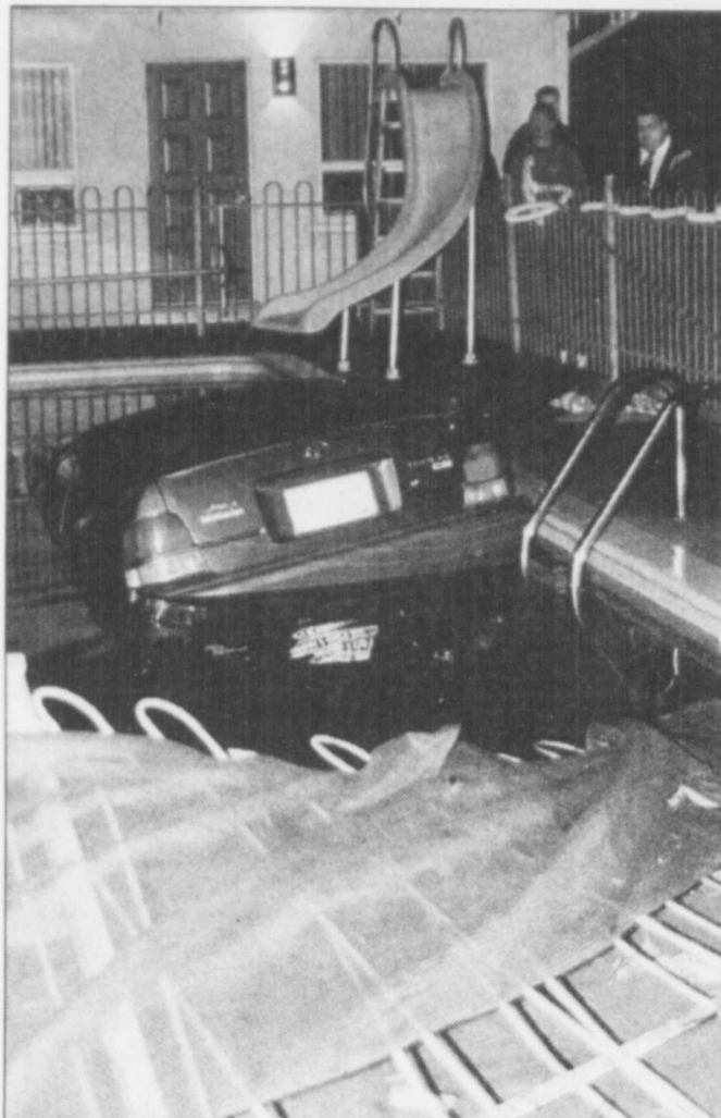
COLLABORATION SPÉCIALE, VINCENT FRADET

Une voiture a terminé sa course de façon spectaculaire, peu après 22 h 30, hier, en effectuant un plongeon dans une piscine. Le conducteur du véhicule a fort heureusement réussi à s'extirper de son siège et à sortir de l'eau sans plus de dommages, abandonnant la voiture presque complètement immergée. Il a même réussi à ne pas se mouiller le haut du corps tant il a fait vite, selon les policiers de Québec ! L'incident peu banal s'est produit au 3090, boulevard Sainte-Anne, sur le terrain du motel Giffard, à Beauport. Deux voitures circulaient en direction est, celle roulant sur la voie de gauche se trouvant légèrement devant sa voisine de droite. Oubliant sa présence, le conducteur a décidé de tourner à droite, et les deux autos se sont tamponnées et ont été déportées vers la droite, sur le terrain du motel. L'autre auto a abouti dans la haie. Il a fallu utiliser les pinces de désincarcération pour en extirper le passager. Lui et le conducteur s'en tiraient avec quelques douleurs. C.S.