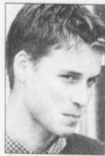
Le prince William

Le prince William passera-t-il une année sabbatique en Australie ou en Argentine avant de commencer ses études supérieures? La question était posée, hier, par le Sunday Telegraph . Le prince âgé de 17 ans, qui sortira en juin du prestigieux collège d'Eton, ferait un stage dans une exploitation agricole, où il s'occuperait des moutons et des bovins. Citant un ami de la famille royale, le