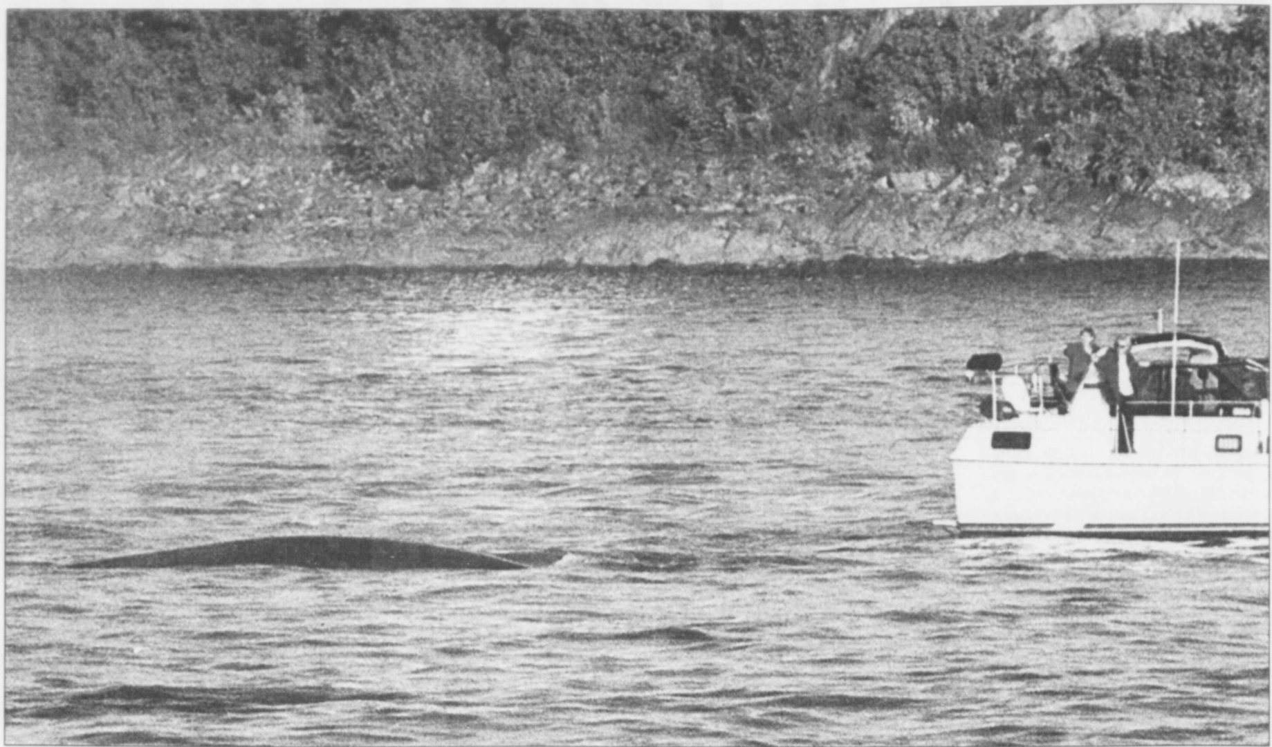
Selon des témoins, il s'agirait d'un rorqual. Son dos noir était visible sur six ou sept mètres.