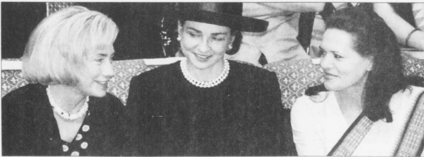
En septembre 1997, M me Chrétien avait rencontré Hillary Clinton et la veuve de Rajiv Gandhi aux funérailles de Mère Teresa.

Par ailleurs, le comité sur l'environnement a subi une défaite dans le dossier de la forêt. Les militants ont écarté l'idée que le Bureau des audiences publiques sur l'environnement se penche sur l'exploitation des forêts, une gestion dénoncée par le film L'Erreur boréale . M.C.