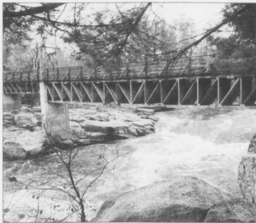
La chute à Murphy serait complètement noyée par le rehaussement du niveau d'eau.

Et ces trois villages, dont le plus gros compte à peine 2000 habitants, n'ont pas les moyens d'investir les