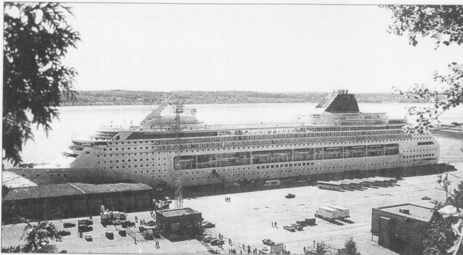
À l'arrivée du paquebot, tout était déjà en place pour recevoir passagers et bagages.