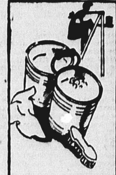
Tout comme deux téles valent mieux qu'une, deux seaux valent mieux qu'un. Burtout au moment du grand ménage, alors qu'il s'agit de nettoyer armoires et réduits. Ces seaux "siamois" contiennent l'un de l'eau savonneuse et l'autre de l'eau pour le rinçage, de sorte que vous n'aurez pas à faire d'arabâtes lorsque vous démolirez de l'eau fraîche.