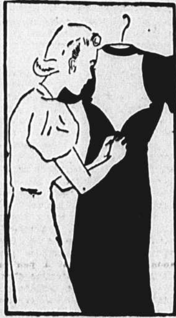
Voilà un autre protecteur, très léger, pour le dos de vos robes, cette fois. Il est à l'épreuve de la transpiration; mais il est de tissu et non caoutchouc, de sorte qu'il n'est pas trop chaud. Il se vend avec les épingles qui le maintiennent en place.