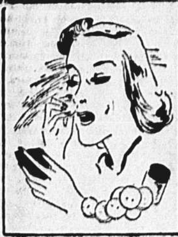
Très pratiques, ces petits sachets imprégnés de lotion, qui ne s'attachent pas et vous permettent de redonner à tout moment du jour une fraîcheur nouvelle à votre épiderme.