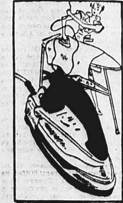
Un fer à repasser sans corde! Non... ce n'est pas un fer radio... ni rien de semblable. C'est l'appui-fer qui se trouve chauffé, et la chaleur s'emmagasine dans le fer et y est distribuée par un minuscule commutateur. Si vous devez toujours, comme la petite dame de la vignette, vous battre avec la corde, c'est le fer qu'il vous faut.