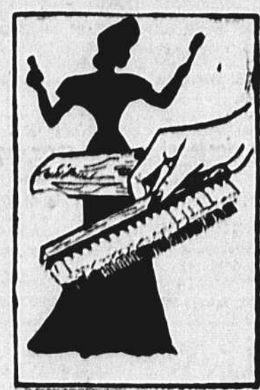
Il semble que l'ère du peigne et de la brosse soit condamnée à suivre le chemin pris par l'époque du cheval et du boghe... à présent qu'on donne à la brosse des lignes aéro-dynamiques et qu'on l'incorpore au peigne. C'est le dernier mot, pour remettre les vagues en place. Le tout est de grandeur à le mettre dans sa poche, et présenté avec un joli étui.

Au préalable, pour calmer les feux de cet épiderme si délicat, tout le corps sera poudré avec du talc pulvérisé adoucissant le contact des premiers vêtements qui recouvriront sa fragile nudité.