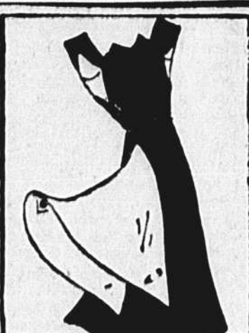
Ces nouveaux protecteurs pour les nippelles de vos robes ont des extrémités pointues, ce qui les fait tenir en place, et un peu de ruban supplémentaire, avec des épingles aux deux bouts