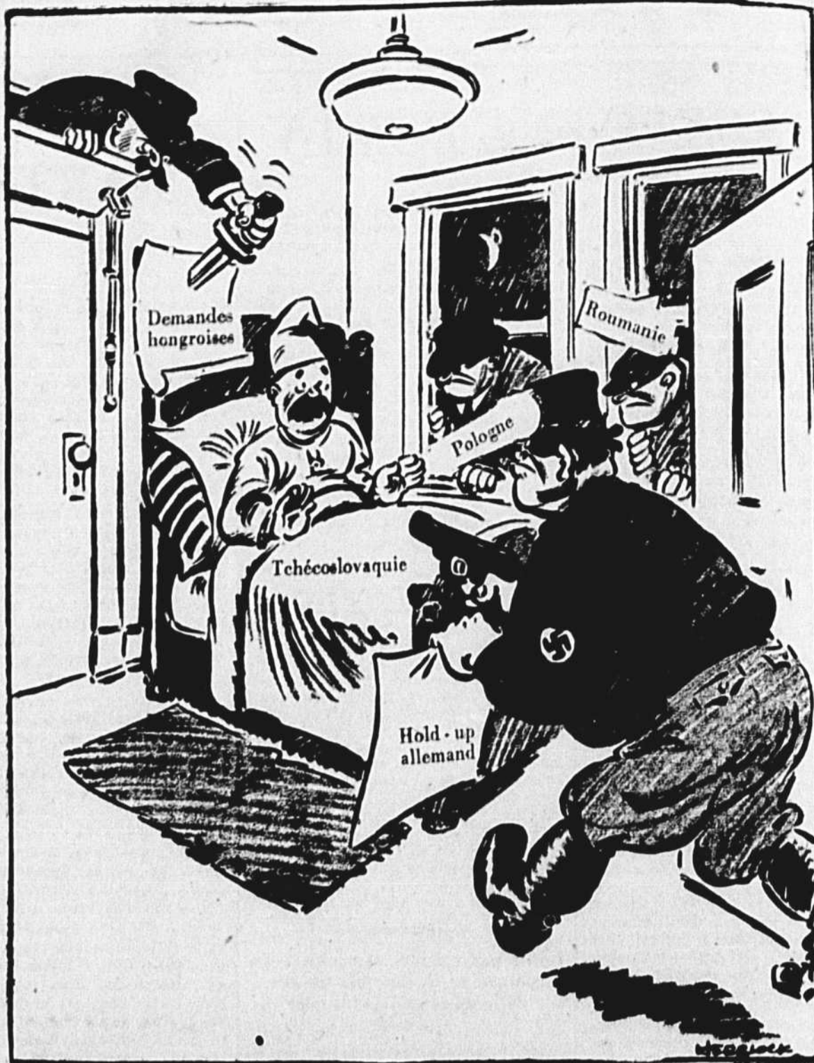
Pas tous à la fois, je vous en prie!