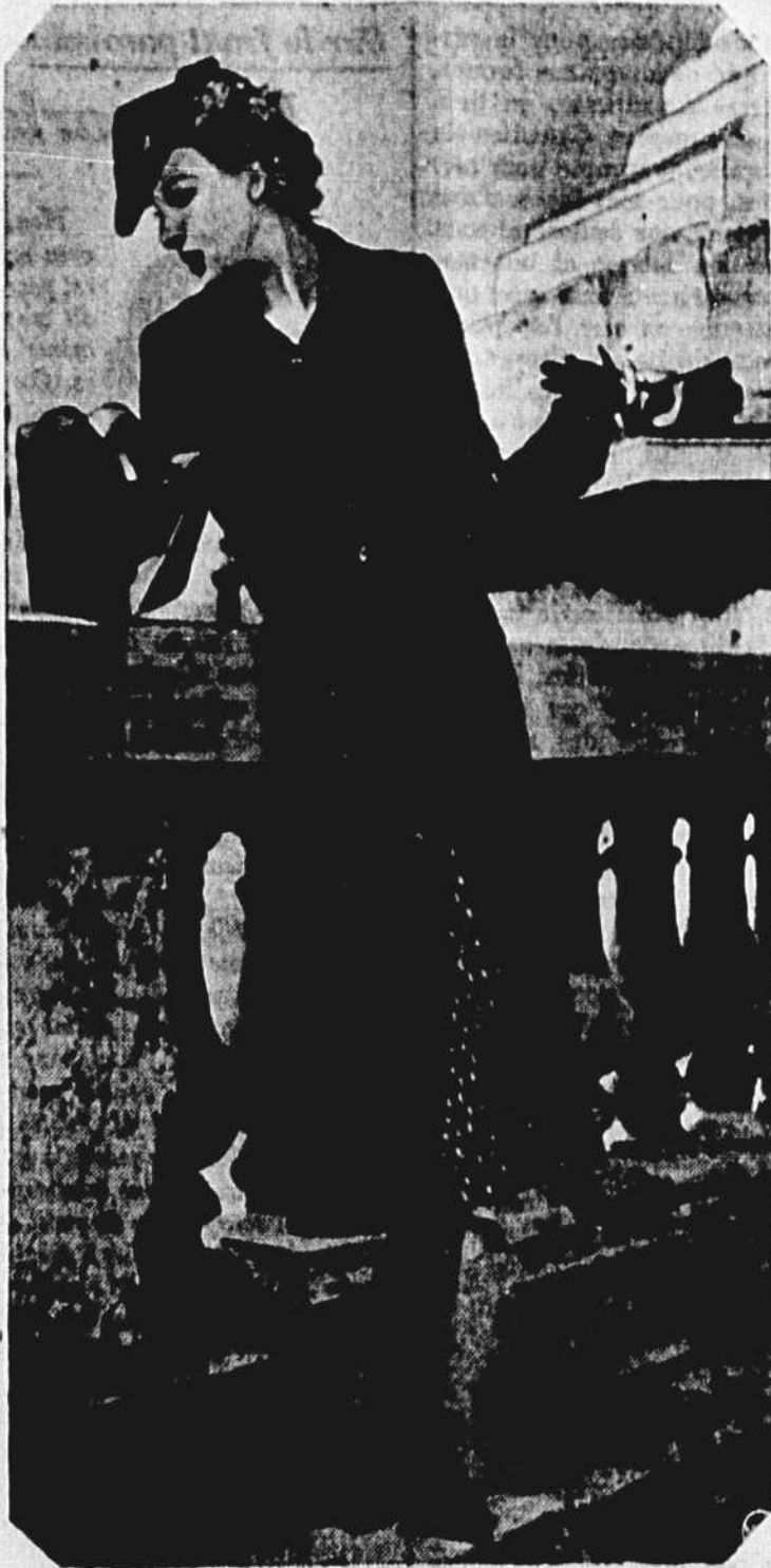
Les tissus à carreaux sont très populaires à Paris, cette saison. Ce modèle, signé Molyneux, comprend une jupe de laine plissée, à carreaux rouges et noirs, très jeune d'allure, et une petite jaquette de jersey noir, au dos ajusté, avec des revers arrondis.