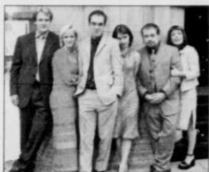
Trois couples drôlement assortis dans « Amour et petits bonheurs ».

Thema , ARTV à 19 h : pour inaugurer la nouvelle chaîne culturelle, une visite des jardins de Versailles, suivie à