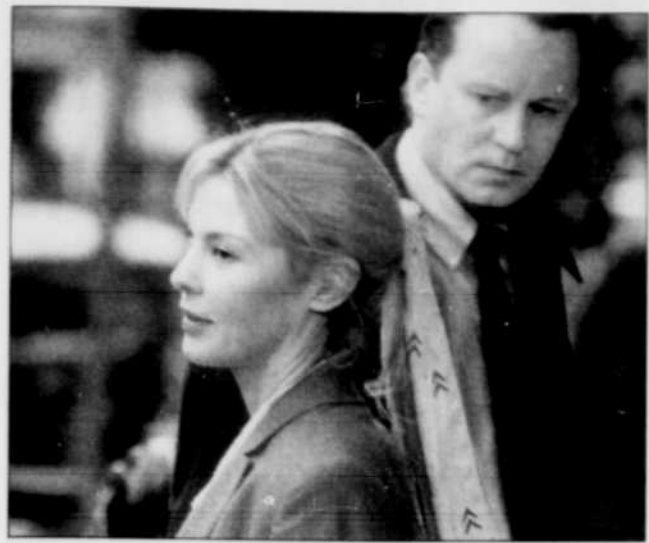
Alec Fenton (Stellan Skarsgård) quitte son épouse Marjorie (Charlotte Rampling) pour Katherine (Deborah Kara Unger), une jeune Américaine.