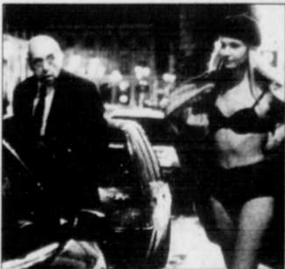
Jean-Luc Godard proposera avec « Éloge de l'amour » du cinéma d'auteur dans toute sa quintessence.