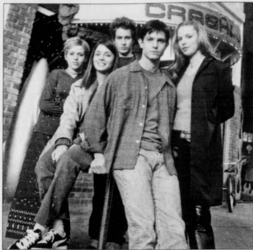
L'équipe de « Roswell », la nouvelle série de VRAK.TV.

20 h du film Si Versailles m'était conté avec Bourvil et Jean Marais. La chaîne ouvre à 18 h. Grands reportages , RDI à 22 h : un reportage sur un groupe de country alsacien qui tente sa chance à Nashville. Télé-nuit : Gazon maudit , Radio-Canada à 22 h 55 : Josiane Balasko est formidable dans cette comédie qu'elle a aussi réalisée. Une femme trompée par son mari se laisse séduire par une camionneuse. Cinéma : L'apprentissage de Duddy Kravitz , Canal D à 23 h : Micheline Lanctôt joue aux côtés de Richard Dreyfuss dans ce film tourné chez nous en 1974.