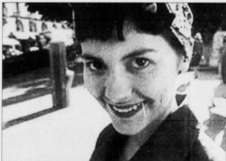
Audrey Tautou dans « Le fabuleux destin d'Amélie Poulain », le film phénomène de l'année en France.