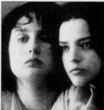
Après le sulfureux « Romance », Catherine Breillat explore les mœurs intimes féminines dans « À ma sœur! ».