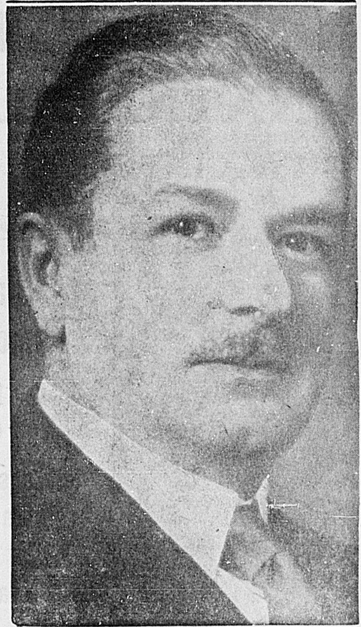
L'hon. Maurice L. Duplessis, chef du parti de l'Union nationale et premier ministre de la province, qui sera le principal orateur à un grand ralliement de l'Union nationale, lundi prochain, à Saint-Denis-sur-Richelieu.