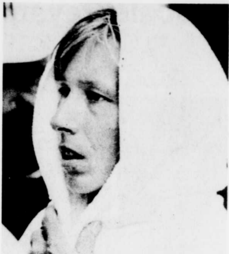
Martina Navratilova est favorite pour arracher un autre titre.

Mandlikova a fait les démarches administratives nécessaires depuis son mariage, l'été dernier, à Prague, avec un Australien de Sydney d'origine tchèque. "Je me sens chez moi maintenant en Australie. Je suis encore plus motivée pour réussir une performance", devait dire la championne tchèque.