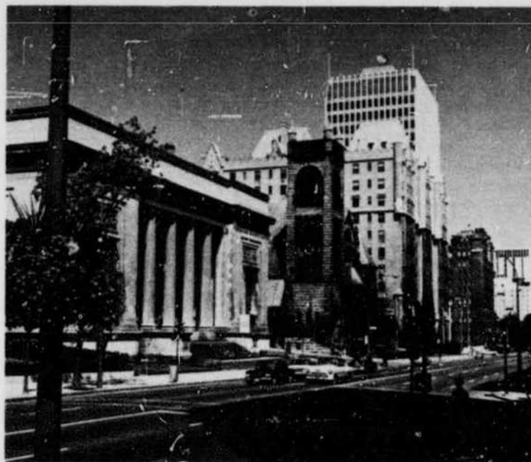
Montreal Museum of Fine Arts, Sherbrooke Street West Musée des Beaux-Arts de Montréal, rue Sherbrooke ouest

à l'Ile-Jésus, traverse la rivière des Mille-Iles jusqu'à Rosemere, puis se rend à Ste-Adèle. C'est une voie divisée avec quatre postes de péage, 67 ponts et croisements pontés.