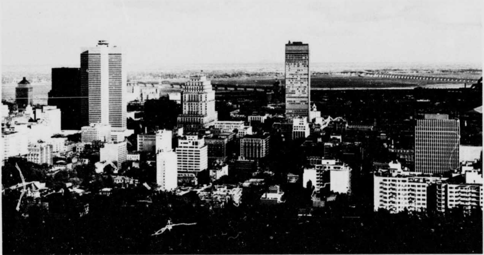
General view of Montreal from Mt. Royal