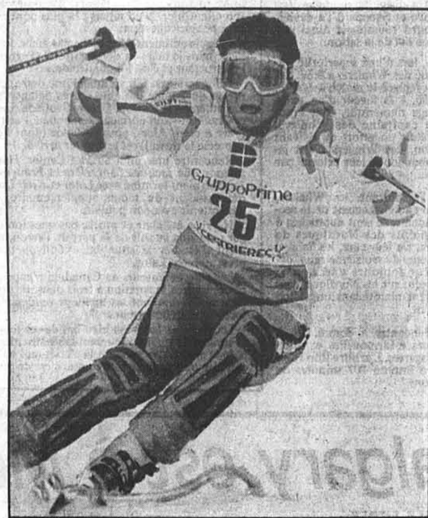
Alberto Tomba a réalisé, hier, le meilleur temps de chacune des deux manches du slalom de Sestrières. Il a ainsi obtenu sa première victoire en Coupe du monde.

Les Flyers ont fait l'acquisition, hier, du défenseur Bill Root. Root, offert au repêchage sans droit de rappel par les Blues de St-Louis jeudi, n'a récolté aucun point en neuf matches cette saison. Il a amorcé sa carrière dans la LNH sous les couleurs du Canadien, le 4 octobre 1979. Le Canadien l'a échangé aux Maple Leafs de Toronto le 21 août 1984.