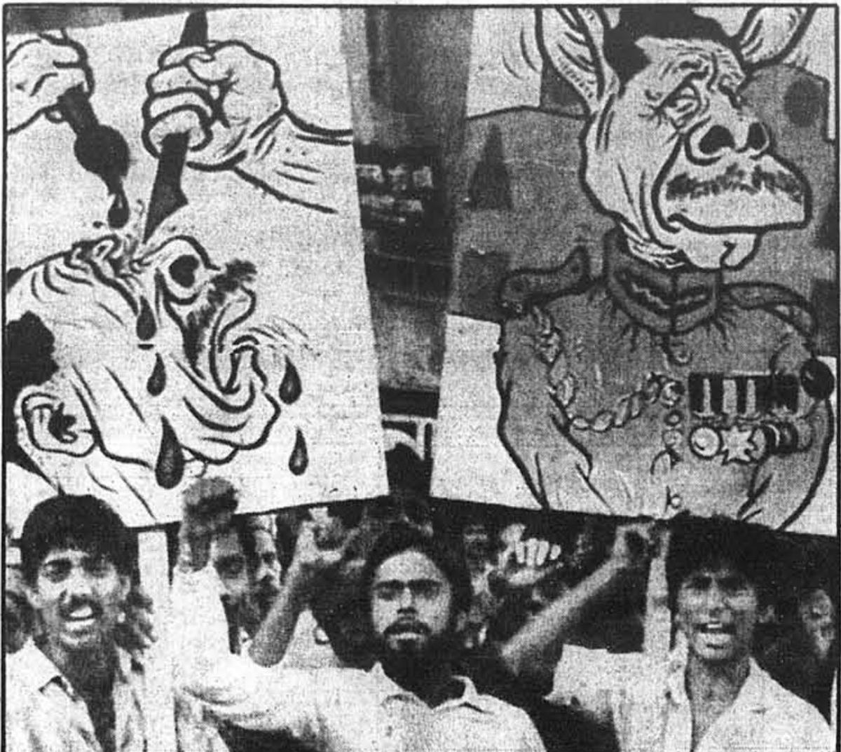
Les artistes de la radio et de la télévision d'État se sont joints au mouvement d'opposition au général Ershad.

Parmi elles figurent les chefs de file des deux principaux partis d'opposition, Begum Khaleda Zia (PNB), veuve du général Ziaur Rahman, président assassiné en 1981, et Sheikh Hasina Wajed (Ligue Awami), la fille de Sheikh Mujibur Rahman, le père de l'indépendance assassiné en 1975.