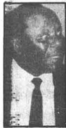
M. Enos Nkala, ministre de l'Intérieur du Zimbabwe, en conférence de presse

À Londres, le chef de l'opposition zimbabwéenne Joshua Nkomo a dit ressentir comme une insulte les insinuations officielles cherchant à imputer ce massacre aux membres de son parti. «Que pourrions-nous avoir à gagner à tuer des gens venus au Zimbabwe pour aider le pays?», s'est insurgé le chef de la ZAPU.