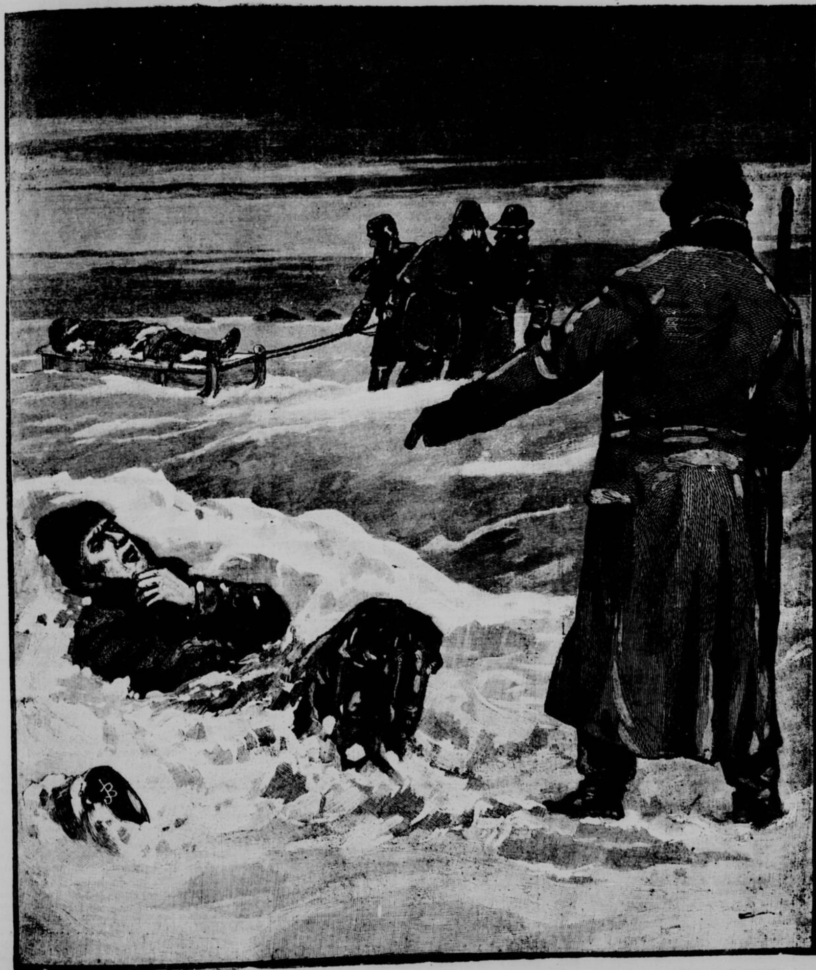
ÉTATS-UNIS : LA DERNIÈRE TEMPÊTE DE NEIGE DANS LE DAKOTA. — UN PARTI D'HOMMES A LA RECHERCHE DES CORPS DES VICTIMES DE LA TEMPÊTE.—DESSIN DE M. A. ROBINSON

La ligne, par insertion . . . . . 10 cents Insertions subséquentes . . . . . 5 cents Tarif special pour annonces à long terme