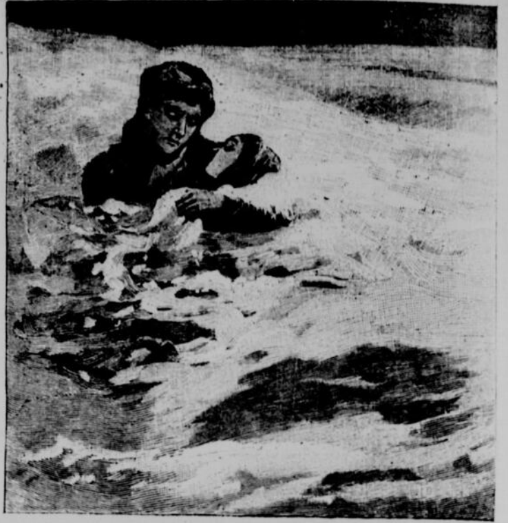
LA DERNIÈRE TEMPÊTE DE NEIGE AUX ÉTATS-UNIS. — UNE MAITRESSE D'ÉCOLE FAIT MARCHER UNE ÉLÈVE PENDANT TOUTE LA NUIT POUR COMBATTRE LE FROID. — UNE AUTRE BRAVE INSTITUTRICE DÉFEND UNE DE SES ÉLÈVES CONTRE LA TEMPÊTE