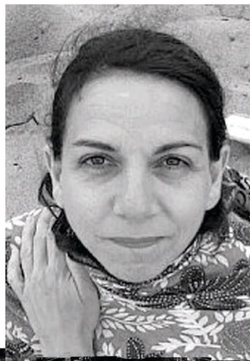
La metteure en scène